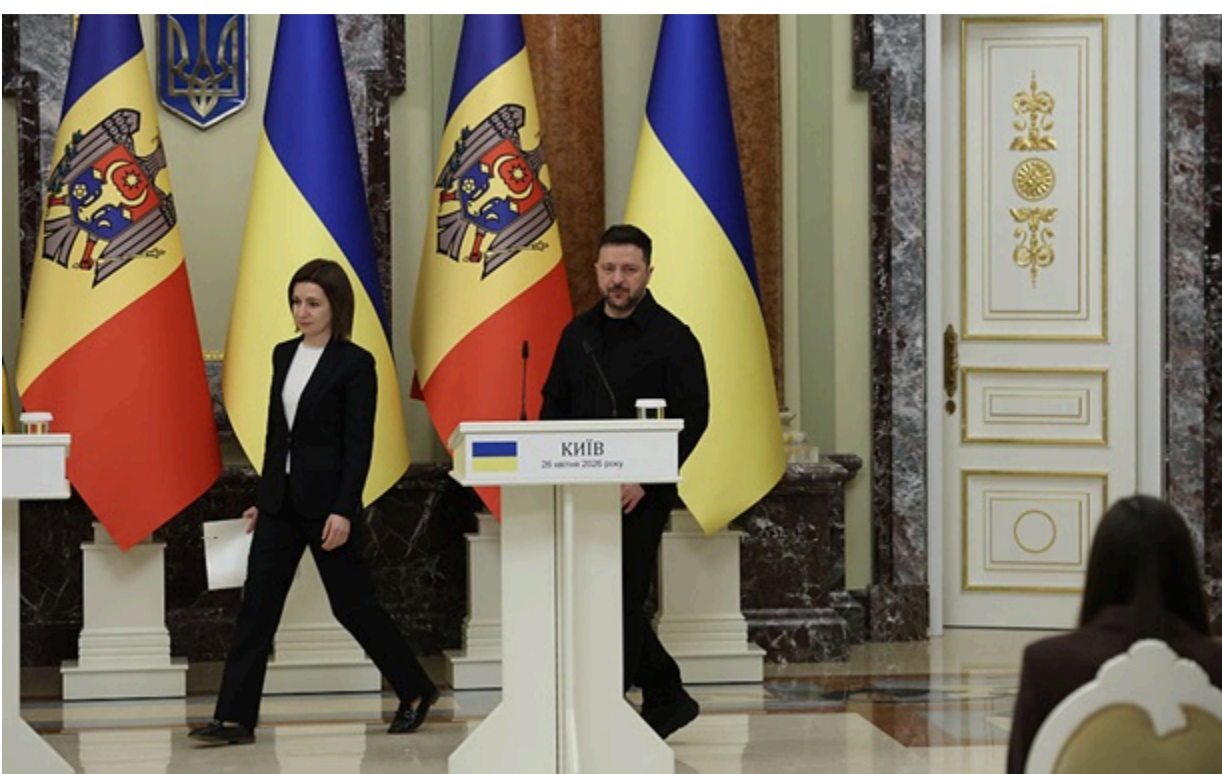
Україна та Молдова можуть розпочати офіційні переговори про членство в ЄС у червні

Будапешт більше не наполягає на блокуванні руху України до Євросоюзу, що відкриває шлях до старту формальних переговорів про вступ обох країн у найближчі дні.