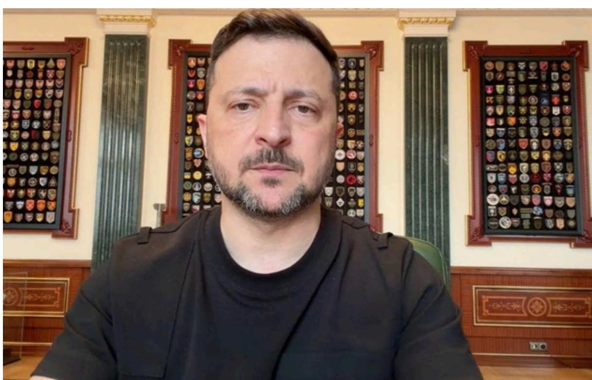
Фото: Пресслужба президента України Зеленський попередив про можливий масований удар РФ цієї ночі

Рівень постачання для української ППО зараз не дозволяє збивати значну частину ракет, зазначив президент.