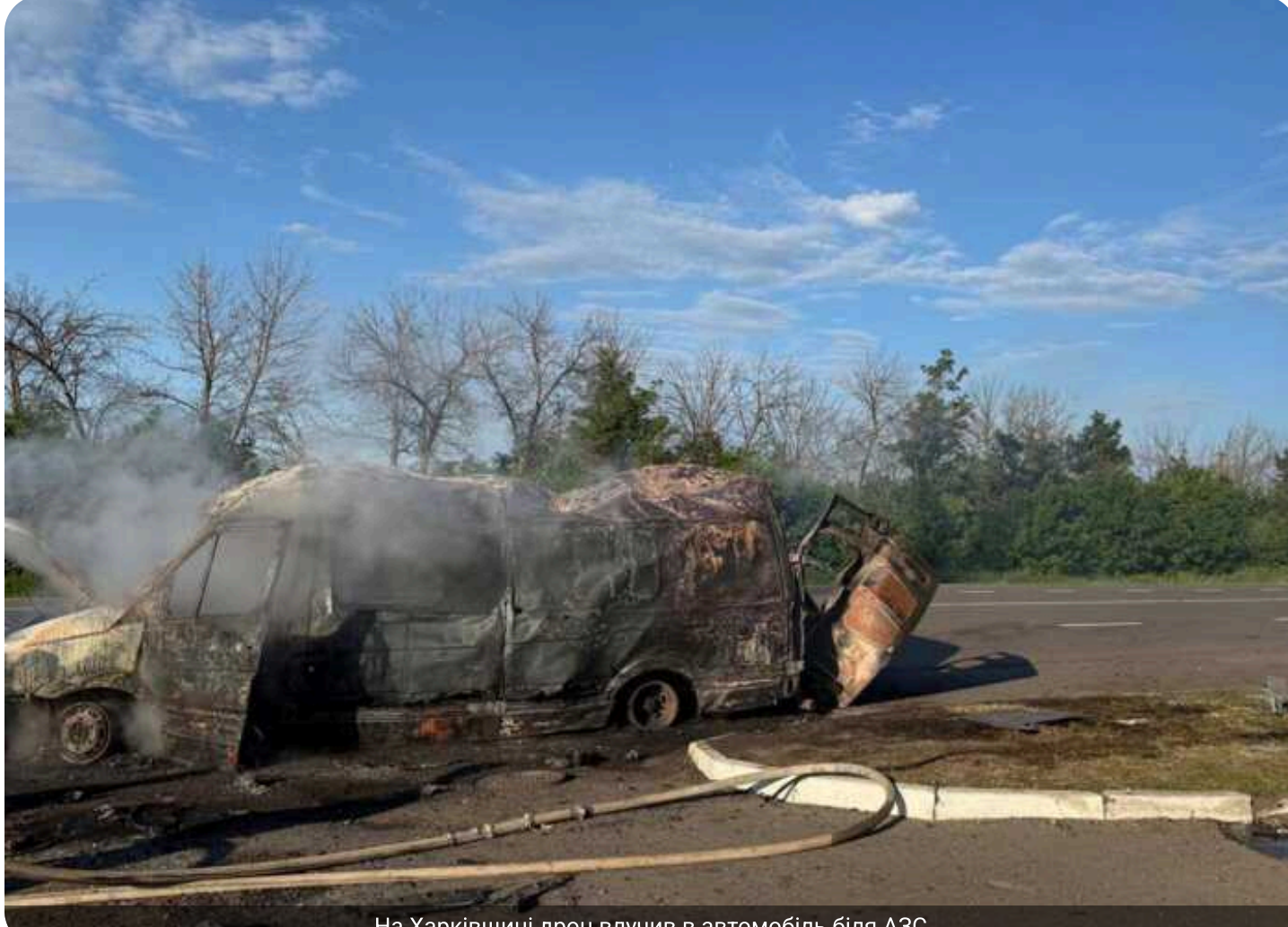
На Харківщині дрон влучив в автомобіль біля АЗС

У Балаклії Харківської області безпілотник атакував автомобіль поблизу автозаправної станції.