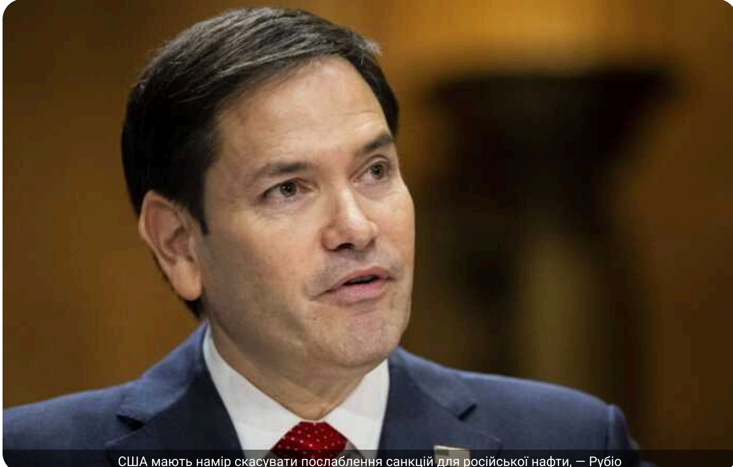
США мають намір скасувати послаблення санкцій для російської нафти, — Рубіо

Державний секретар США Марко Рубіо заявив, що країна хотіла б найближчим часом скасувати винятки з нафтових санкцій проти Росії.