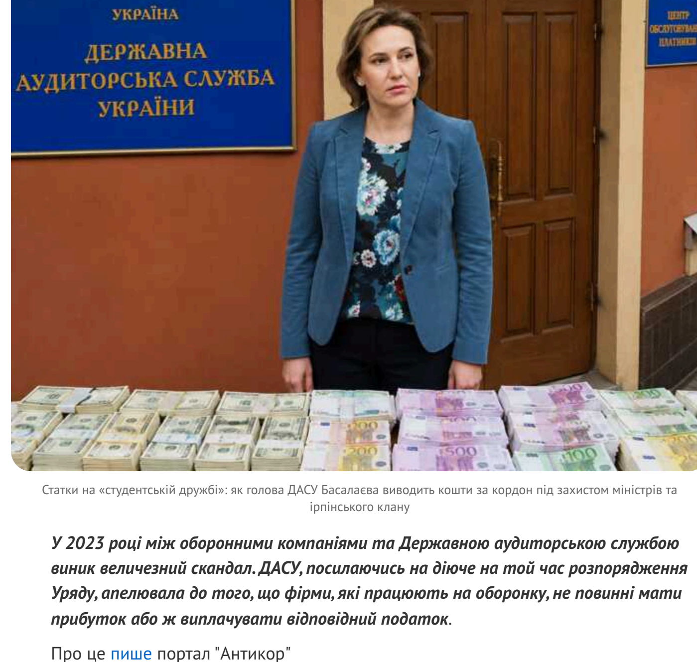
Статки на «студентській дружбі»: як голова ДАСУ Басаласа виводить кошти за кордон під захистом міністрів та ірпінського клану

У 2023 році між оборонними компаніями та Державною аудиторською службою виник величезний скандал. ДАСУ, ліквідаційна фірма, який час розслідує вкрадені гроші, опинилася до того, що фірма, яка працює на оборону, не повинні платити податок або ж вилучувати відповідний податок.