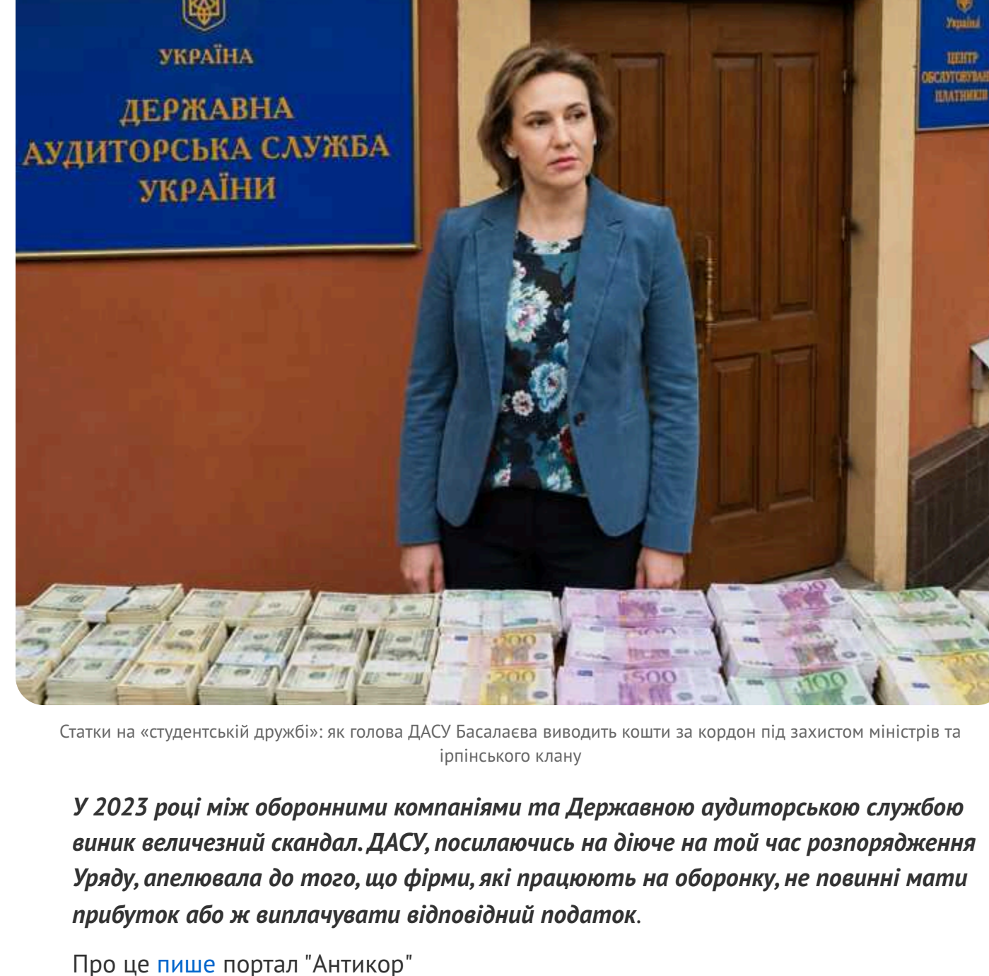
Статки на «студентській дружбі»: як голова ДАСУ Басаласа виводить кошти за кордон під захистом міністрів та ірпінського клану

У 2023 році між оборонними компаніями та Державною аудиторською службою виник величезний скандал. ДАСУ, ліквідаційна на той час розпорядчий орган Уряду, опинилося до того, що фірми, які працюють на оборону, не повинні мати прибутку або ж вилучувати відповідний податок.