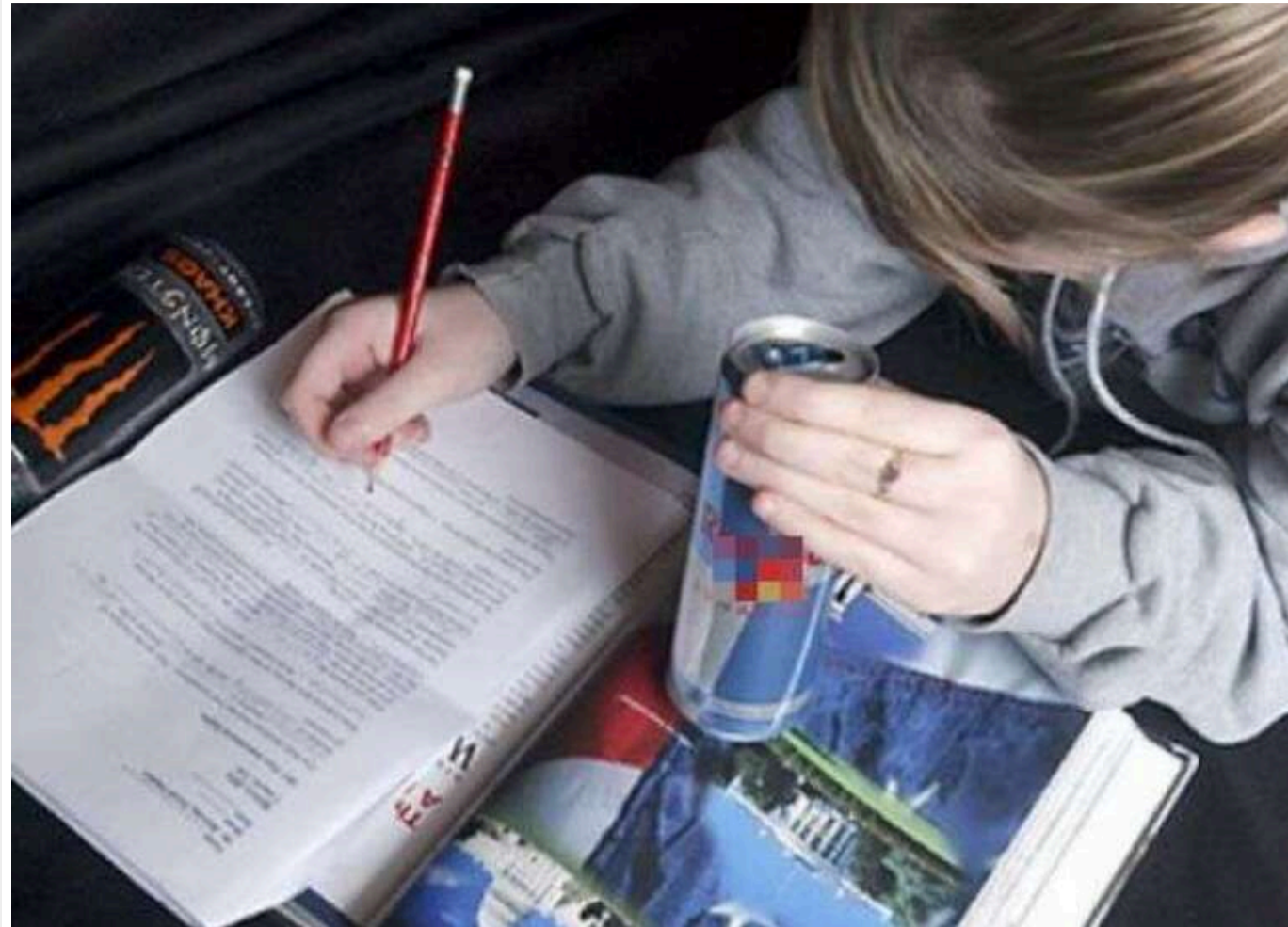
В Україні пропонують штрафи до 17 тисяч гривень за продаж енергетиків неповнолітнім

Народний депутат із Чернігівщини Сергій Гривко виступив ініціатором законопроектів, які стосуються змін до Кодексу України про адміністративні правопорушення, передбачаючи штрафи до 17 000 гривень за продаж неповнолітнім енергетичних напоїв.