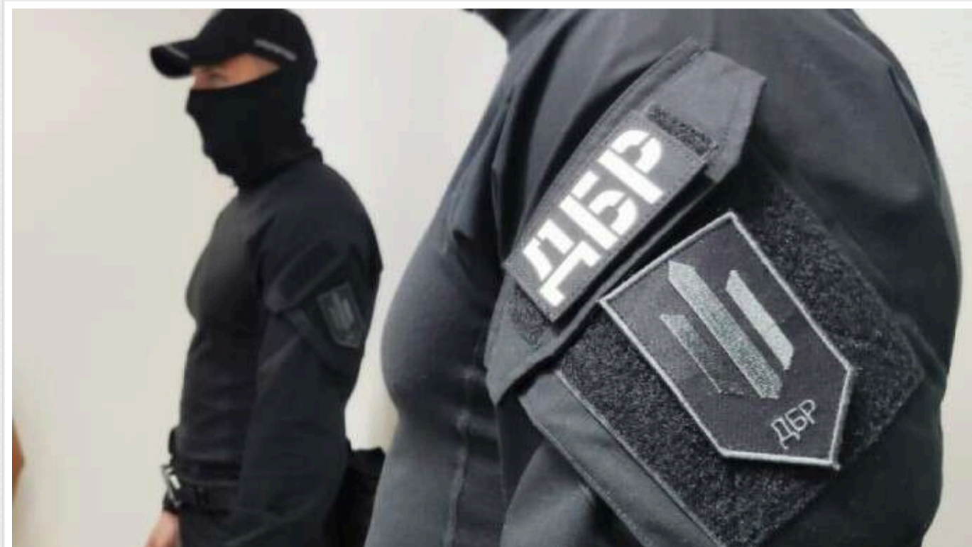
У Миколаєві викрили чергову схему ухилення від мобілізації: видавали фальшиві медичні довідки з діагнозами

У Миколаєві співробітники Державного бюро розслідувань розкрили чергову схему ухилення від мобілізації. Зловмисники видавали військовозобов'язаним фальшиві медичні довідки з діагнозами.