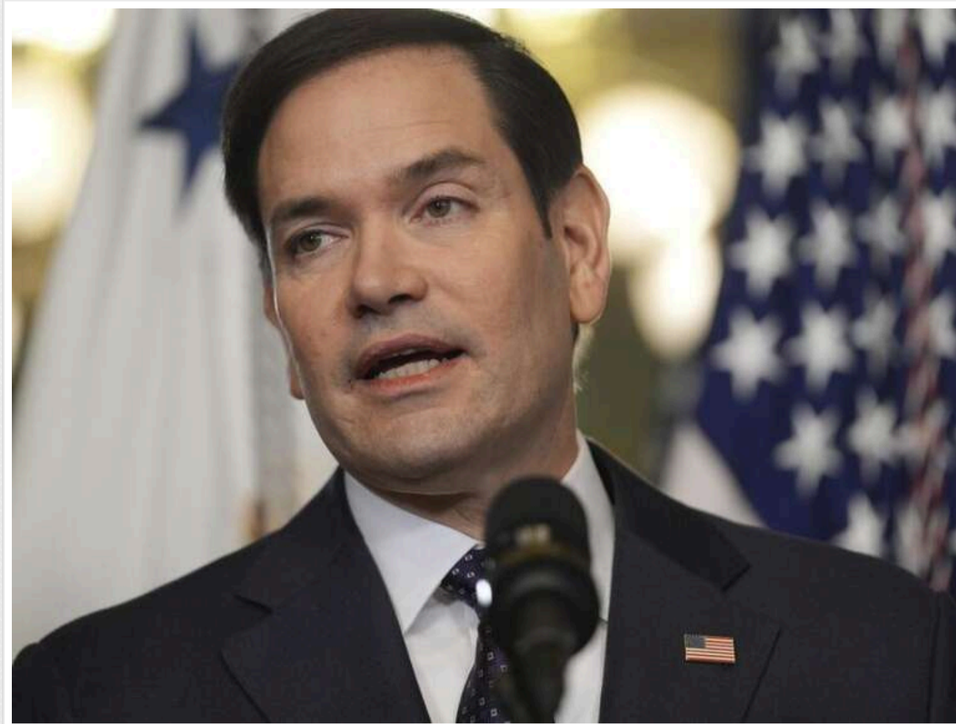
Рубіо різко розкритикував Зеленського за відмову від угоди зі США про корисні копалини

Держсекретар США Марко Рубіо розповів про конфлікт між адміністрацією Дональда Трампа та президентом України Володимиром Зеленським, що виник через відмову останнього від американської пропозиції щодо розробки корисних копалин.