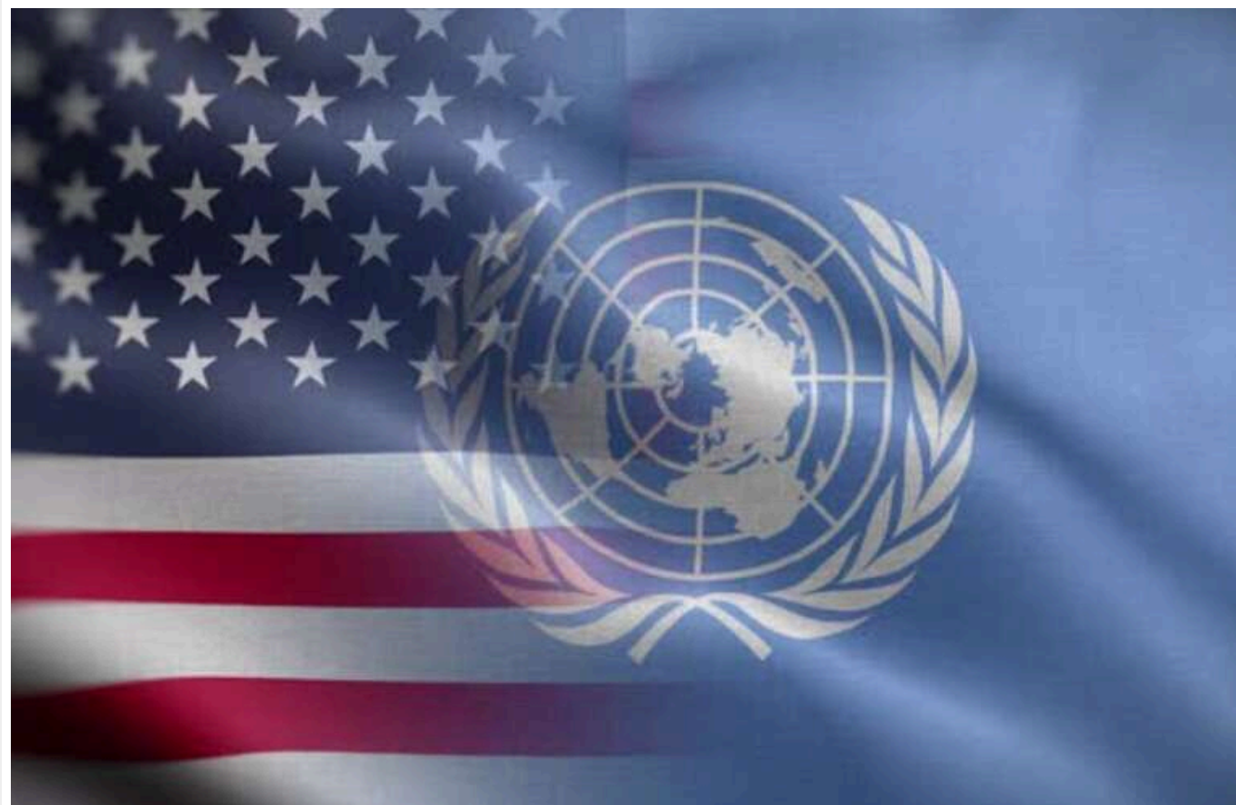
Республіканці ініціювали процес виходу США з ООН, - ЗМІ