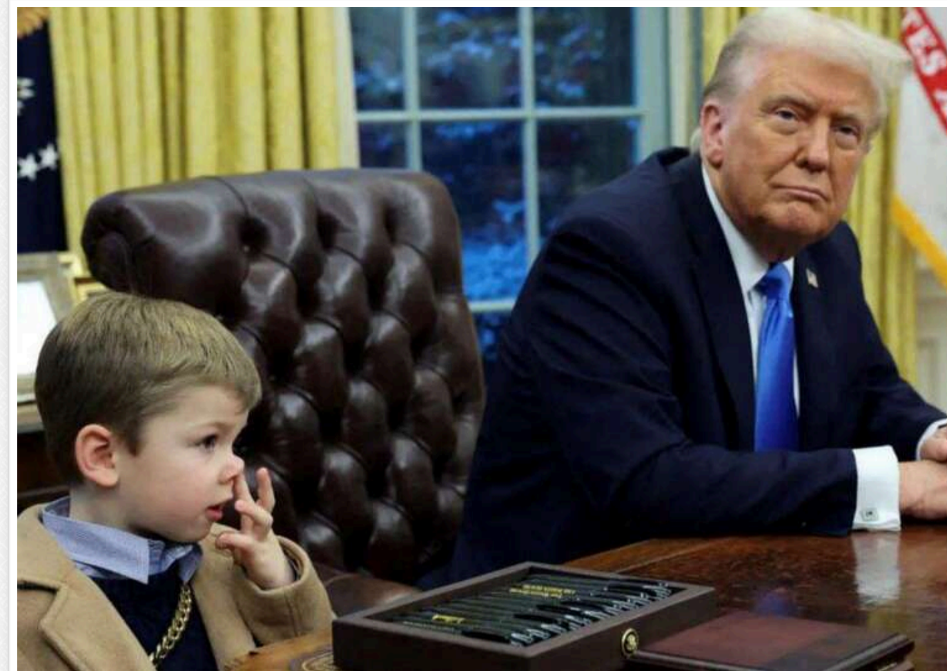
Трамп вирішив відправити на реставрацію легендарний стіл Resolute Desk після того, як син Маска залишив на ньому козявку, - NYP

Зазначимо, що вперше цей стіл використовував Джон Кеннеді в 1961 році, а потім його використовували президенти, такі як Джиммі Картер, Білл Клінтон, Барак Обама та Джо Байден, під час їхнього перебування на посаді.