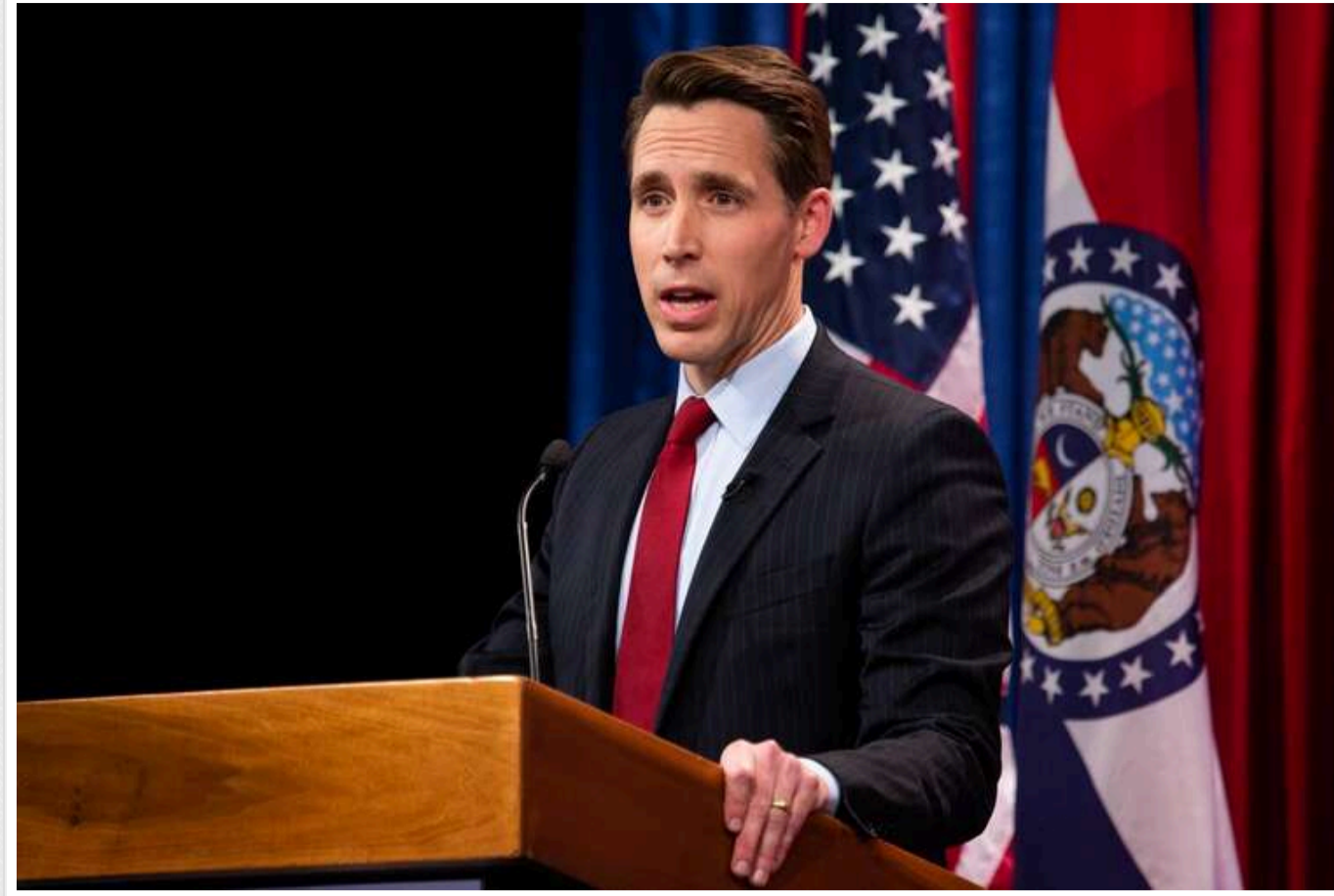
Сенатор США Джош Гоулі пропонує запровадження спеціального інспектора для моніторингу допомоги Україні

Сенатор від штату Міссурі Джош Гоулі знову вніс законопроект, який передбачає запровадження спеціального інспектора для нагляду за витратами на допомогу Україні. Гоулі разом із віцепрезидентом США Дж. Д. Венсом запропонував створення незалежного контролера, який аудиторуватиме понад $174 мільярди, виділені Конгресом на допомогу Україні.