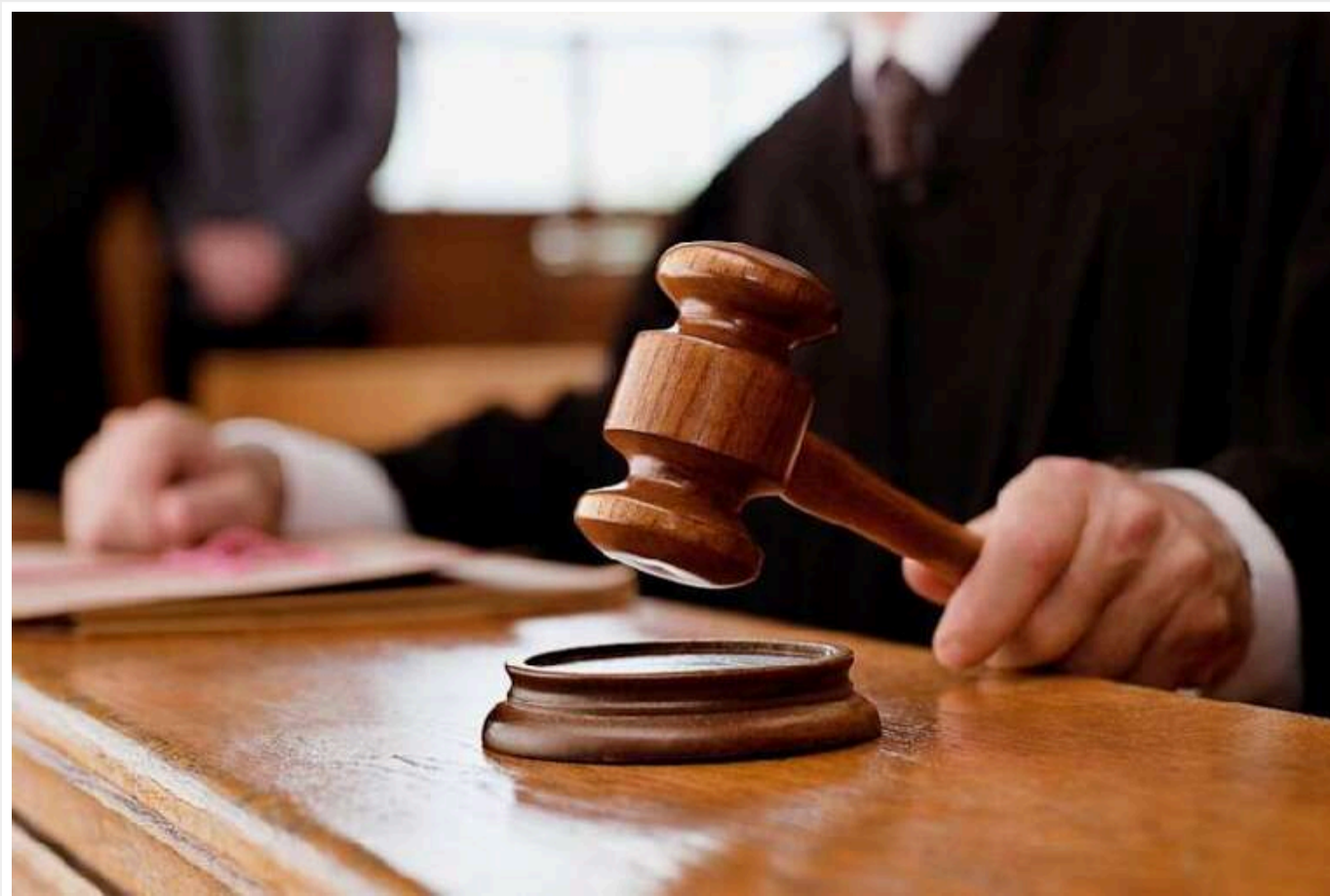
На Полтавщині чоловік відмовився від мобілізації "через невизначеність із датами та проблеми з вагою"

У Полтавській області чоловік відмовився від призову, обґрунтовуючи це тим, що має невелику вагу. Також він скаржився на "плутанину в датах", але суд все ж покарав військовозобов'язаного за порушення закону.