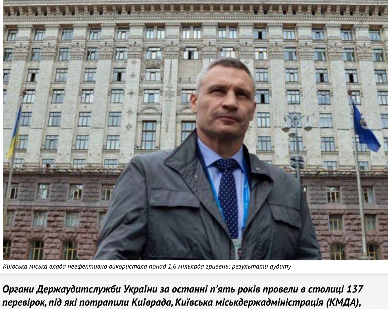
Київська міська влада неефективно використала понад 1,6 мільярда гривень: результати аудиту

Органи Держаудитслужби України за останні п'ять років провели в столиці 137 перевірок, під які потрапили Київград, Київська міськдержадміністрація (КМДА), районні і Київські державні адміністрації (РДА), підпорядковані їм комунальні заклади та підприємства, а також Київська міська військова адміністрація (КМВА). За результатами цих аудитів було зафіксовано різних порушень на загальну суму 444,5 млн гривень (насправді, ця сума являє є значно більшою, адже не всі суми порушень було внесено до "загальної відомості"). На такі результати, як з'ясувалося, "налякалися" політичівати" КМВА (порушень на 118,8 млн), а також департаментних соціальної політики (46,9 млн) і культури (38,7 млн) КМДА. За даними аудиторів, чиновники і "комунальники" традиційно завищували вартість робіт, виплачували працівникам "надлишкові" кошти, на сумнівних підставах використовували комунальні легкові автомобілі тощо. Матеріали 68 перевірок були долучені до кримінальних справ, які розслідують різні правоохоронні органи.