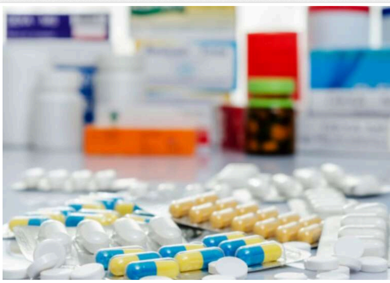
100 найбільш популярних ліків, ціни на які будуть знижені на 30% з 1 березня, – МОЗ

Українські фармацевтичні виробники підписали декларацію про зниження та стабілізацію цін на лікарські засоби.