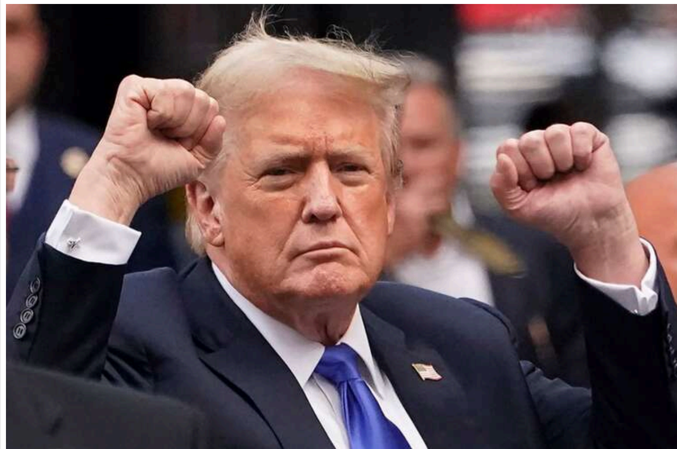
Трамп критикує дистанційну роботу, але сам працював з дому майже половину часу

Дональд Трамп, який вимагає припинити віддалену роботу, провів 12 з 29 робочих днів, працюючи з дому з полем для гольфу.