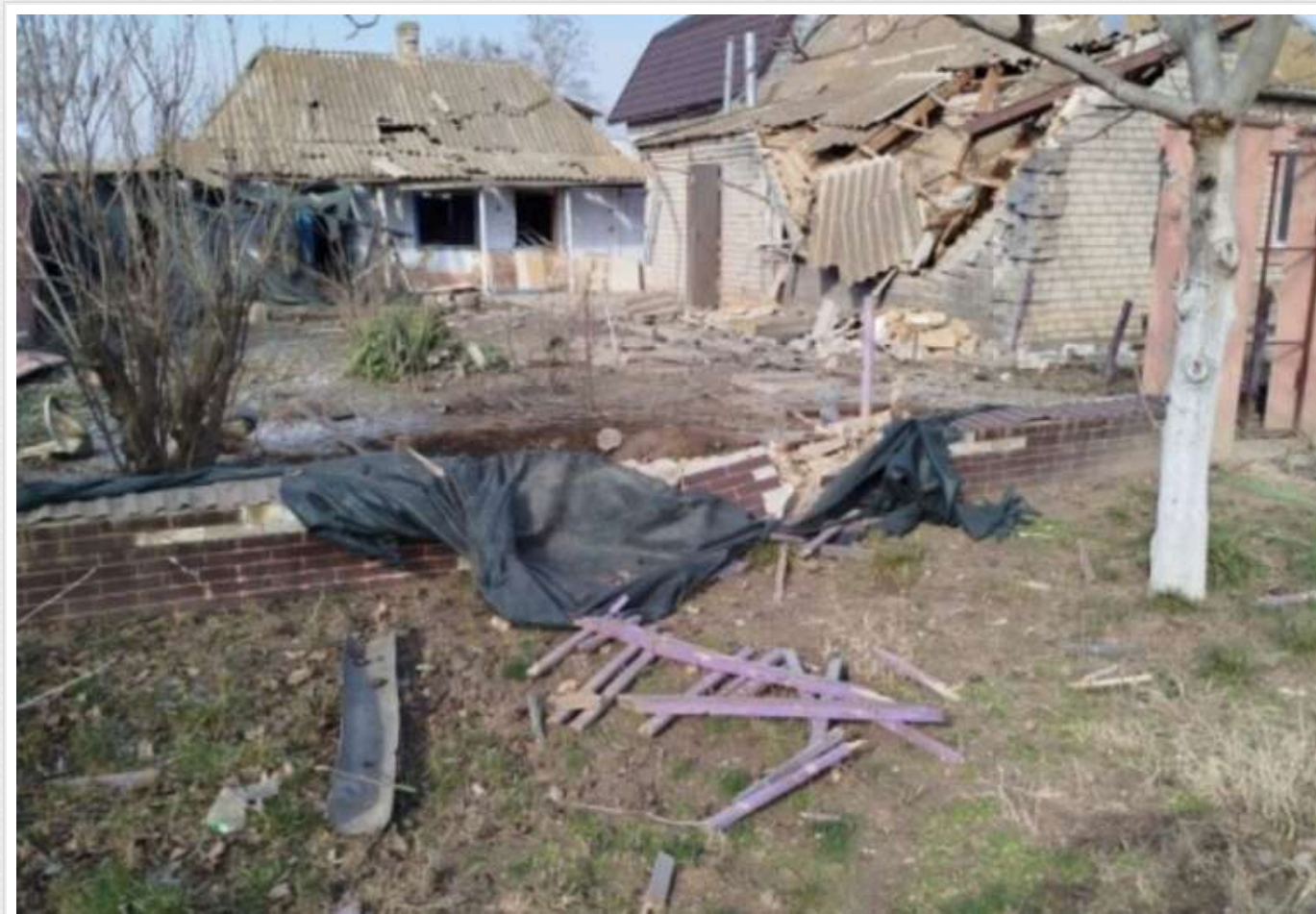
Окупанти зранку обстріляли Білозерку на Херсонщині: пошкоджені будинки