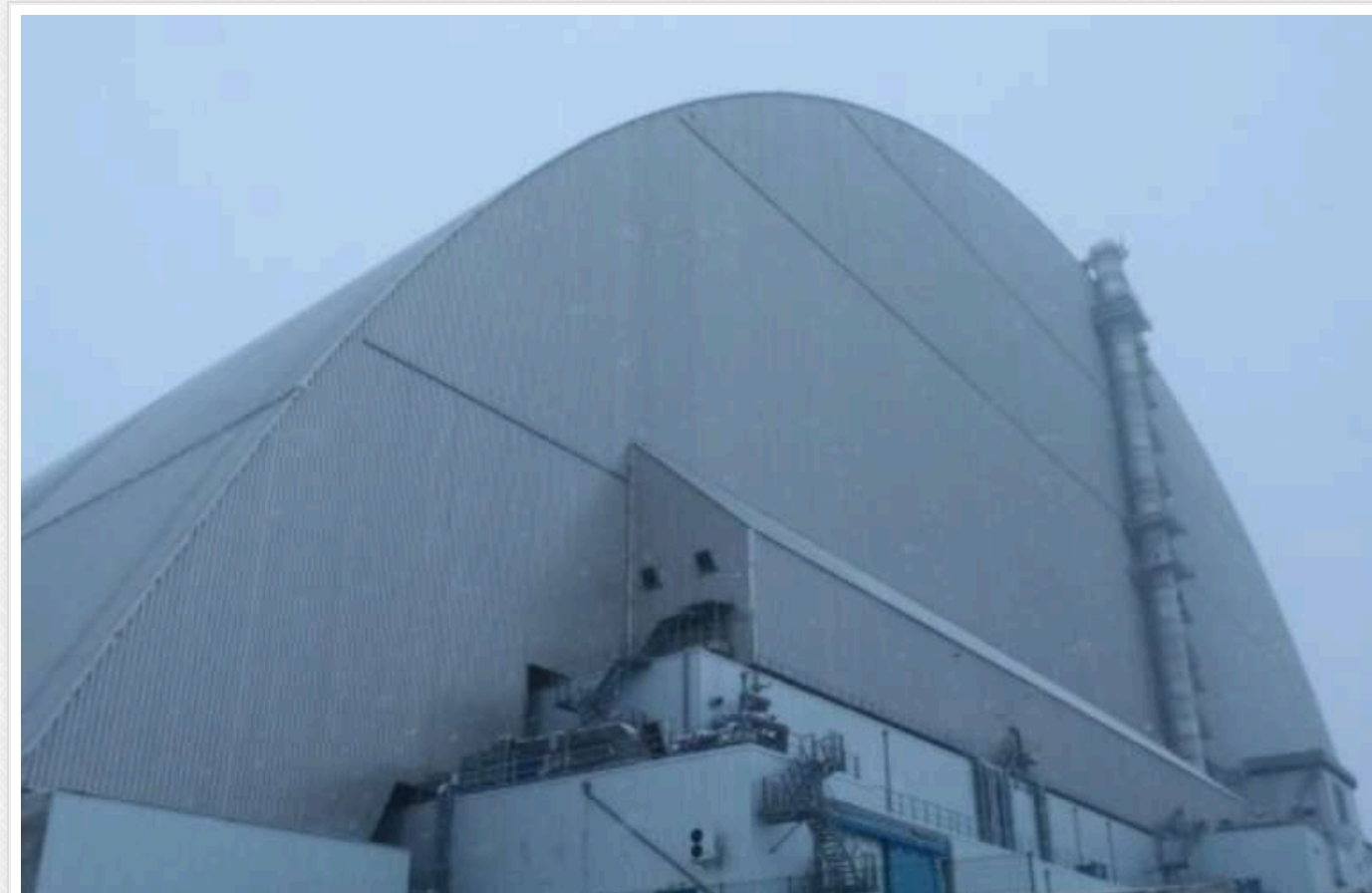
У Чорнобилі радіаційний фон - у межах норми, - обсерваторія Срезневського

Станом на 8:00 20 лютого рівень радіаційного фону в Чорнобилі становить 18 мкР/год.