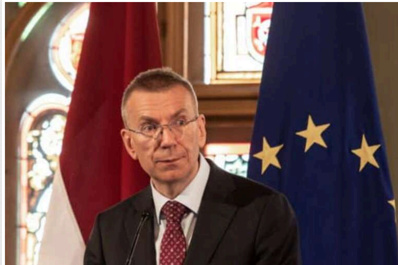
Президент Латвії визначив дві вимоги для направлення миротворчої місії в Україну

Президент Латвії Едгарс Рінкевичс висловив готовність обговорити миротворчу місію в Україні. Проте перед ухваленням рішення про можливе відправлення військових необхідно виконати дві умови.