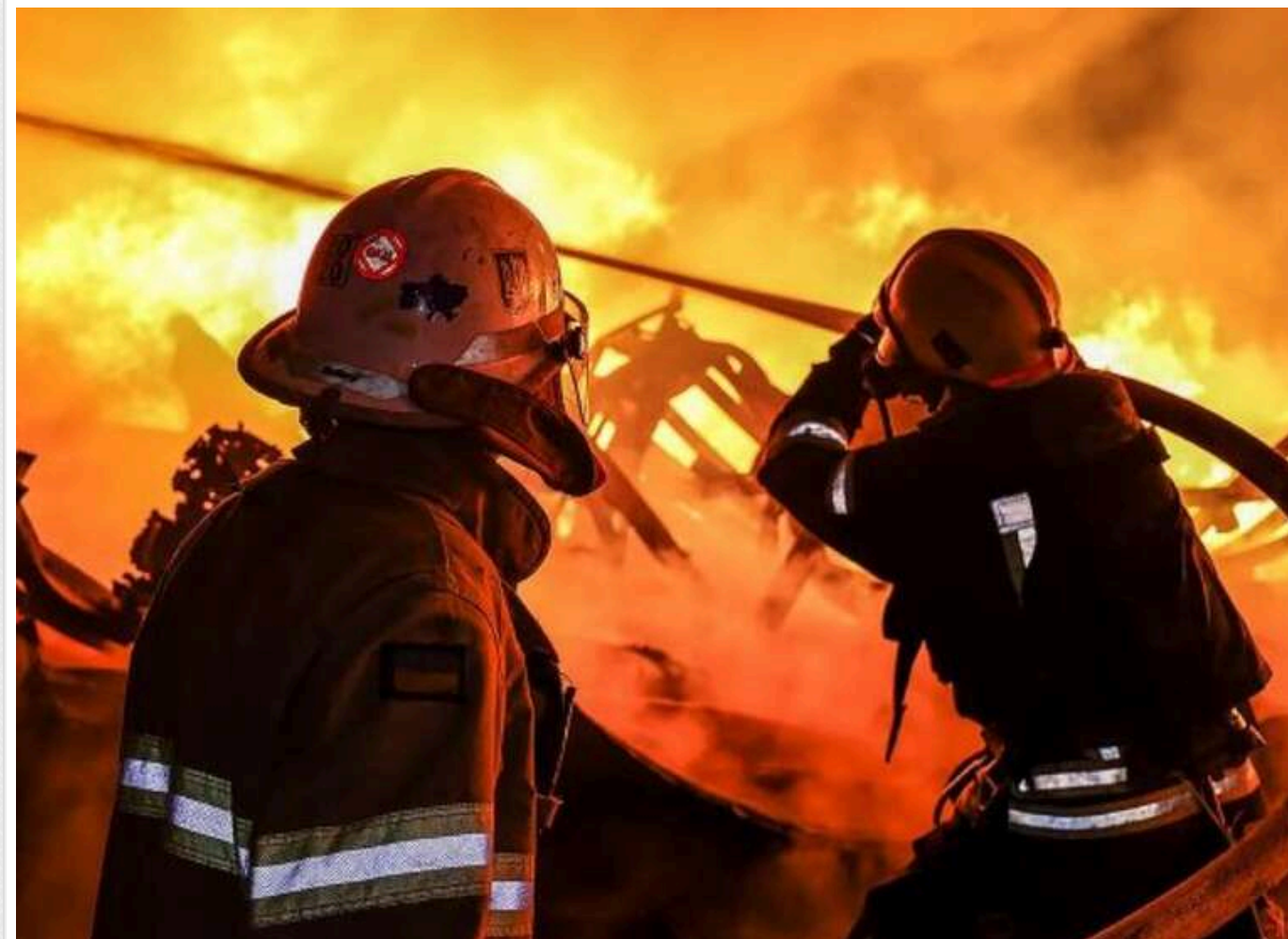
РФ здійснила масовану атаку на газову інфраструктуру України, - Міненерго

Російські окупанти в ніч на 20 лютого здійснили масовану атаку на газову інфраструктуру України. Зазнали uszkodжень, зокрема, виробничі потужності.