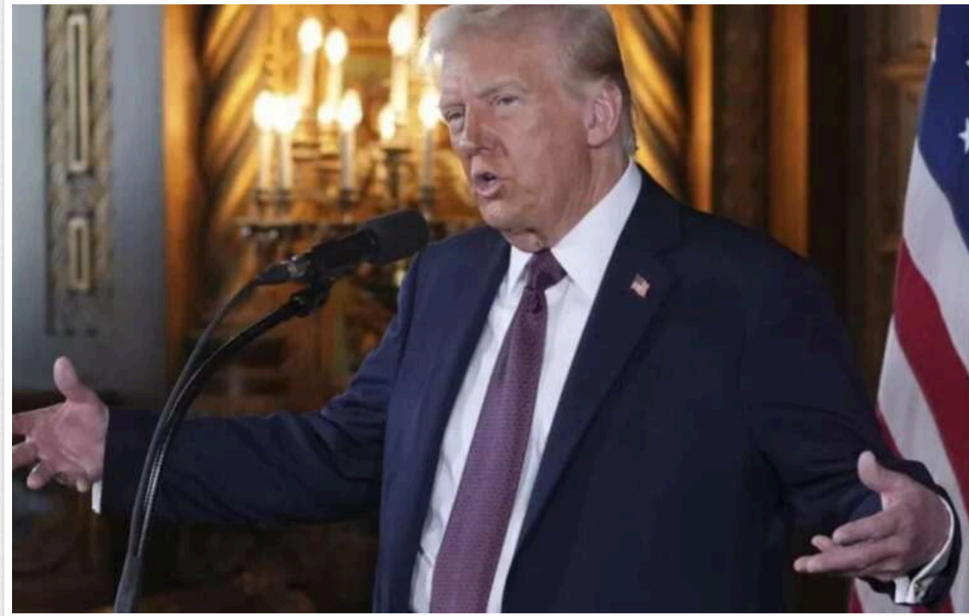
Росія "має козири" в потенційних мирних переговорах, - Трамп

Американський президент Дональд Трамп вважає, що Росія "має козири" у потенційних мирних переговорах щодо завершення війни, оскільки РФ "захопила значну територію".