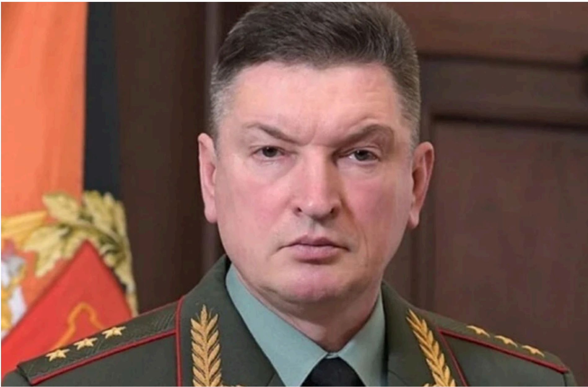
Олександр Лапін / Фото з відкритих джерел

ДЕРЕВ'ЯНКО ГЕЛЕНА — 02 Червня 2026, 19:54 2 Mins Read — ЗЛОЧИНИ