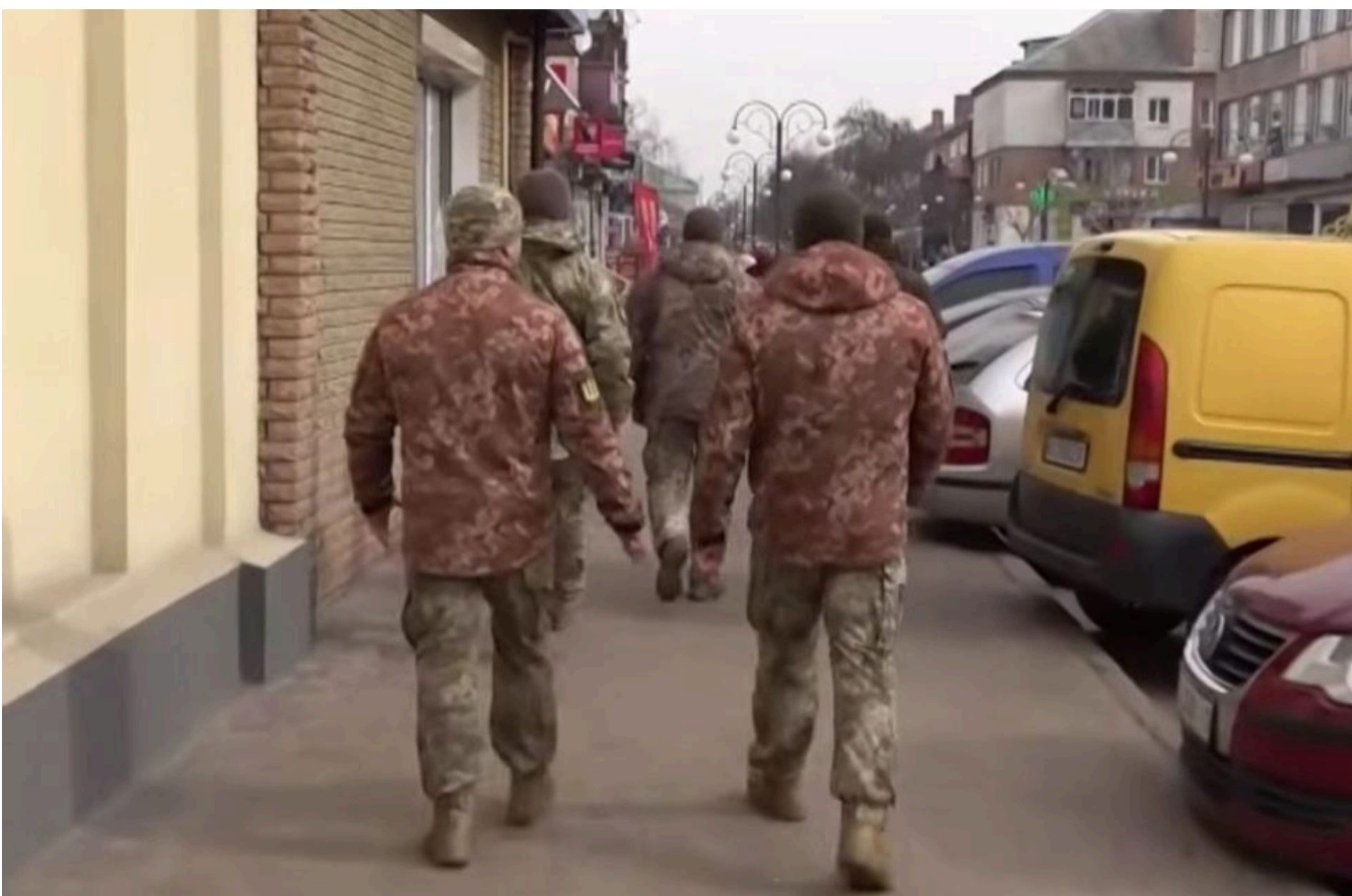
Бронювання працівників

КАРПЕЦЬ ОЛЕКСАНДР — 02 Червня 2026, 20:05 2 Mins Read — УКРАЇНА