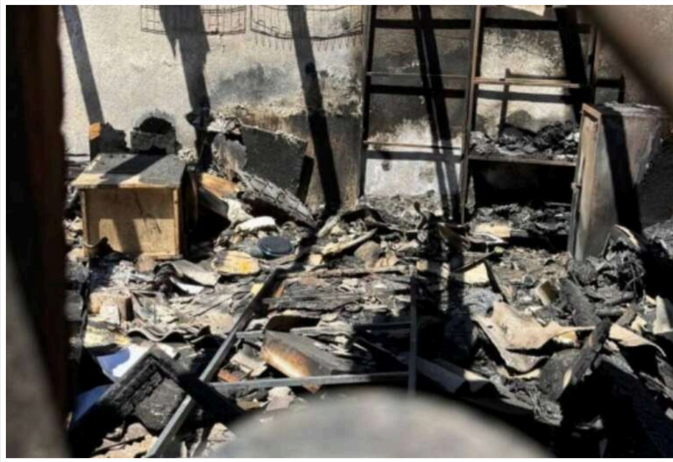
Росіяни в Херсоні пошкодили сортувальний центр "Укрпошти"

Під час ранкового обстрілу Херсона було пошкоджено сортувальний центр АТ «Укрпошта». Раніше ворог влучив у вантажівку компанії, яка прямувала в напрямку Станіслава.