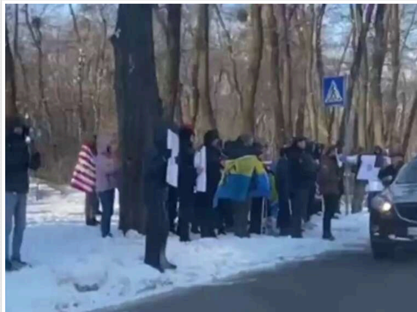
У Києві збирається мітинг біля посольства США у відповідь на критику Зеленського та переговори з Росією

У Києві планується мітинг біля посольства США.