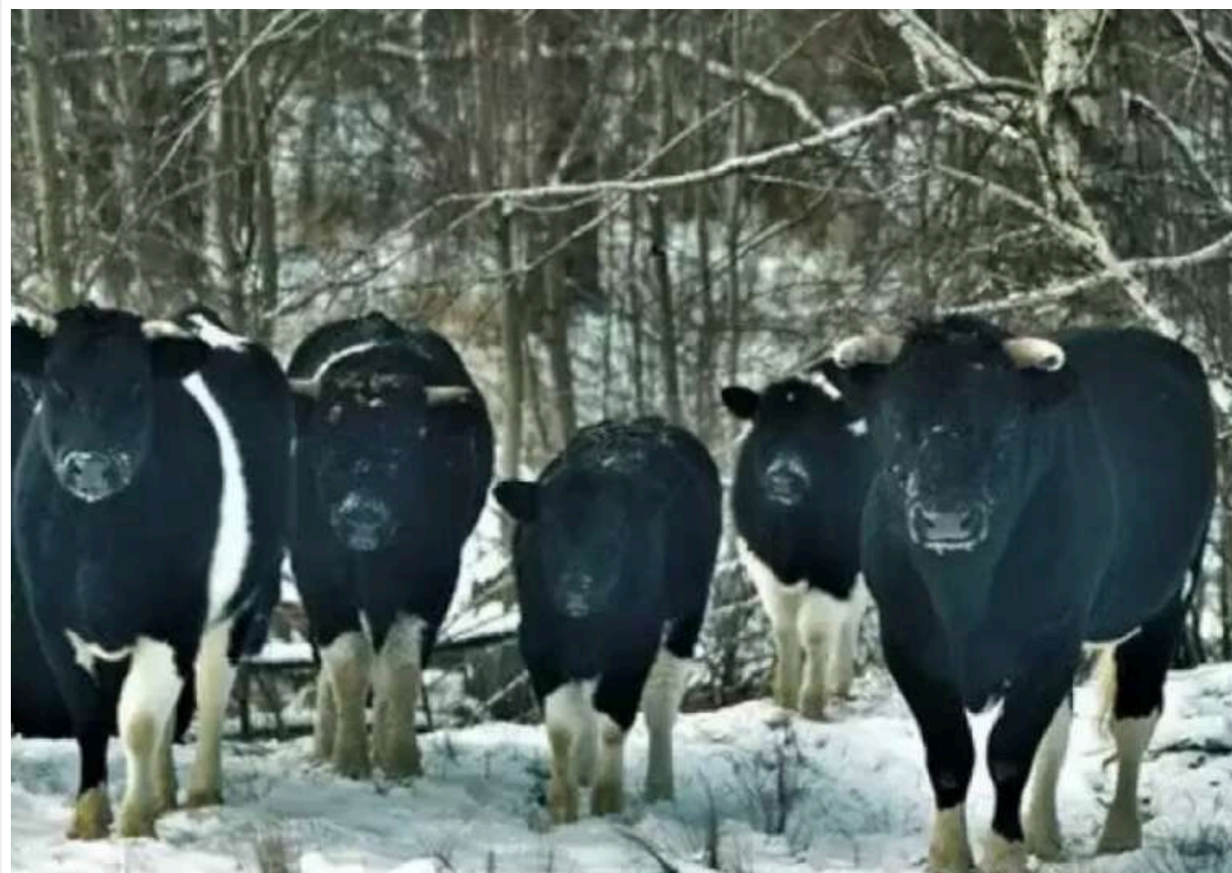
У Чорнобильській зоні зафіксували стадо диких корів

Цей випадок є унікальним для України: хоча за генетикою чорнобильські корови такі ж, як і домашні, їхня поведінка значно змінилася.