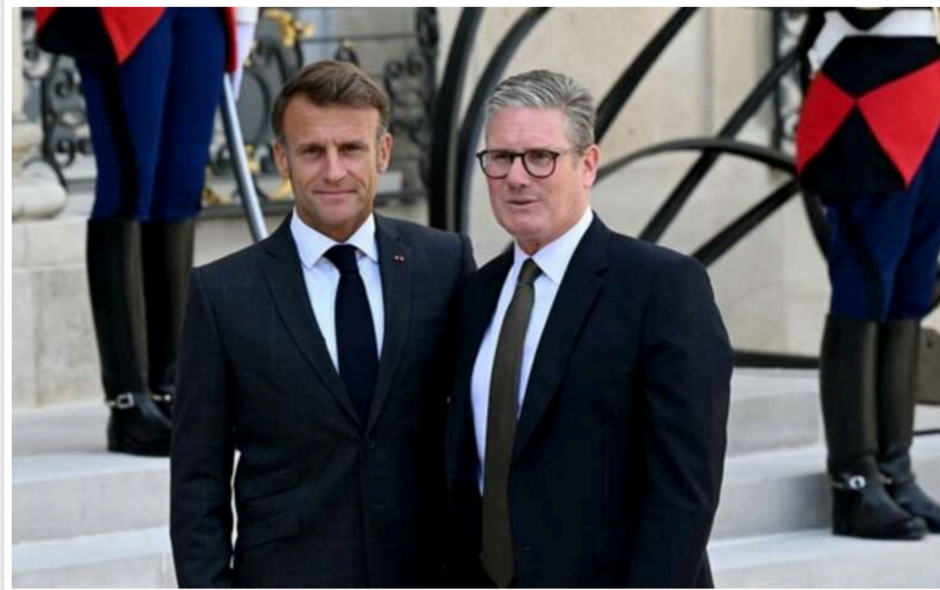
Наступного тижня Макрон і Стармер відвідають Вашингтон

Президент Франції Емманюель Макрон та прем'єр-міністр Великої Британії Кір Стармер відвідають Вашингтон наступного тижня.