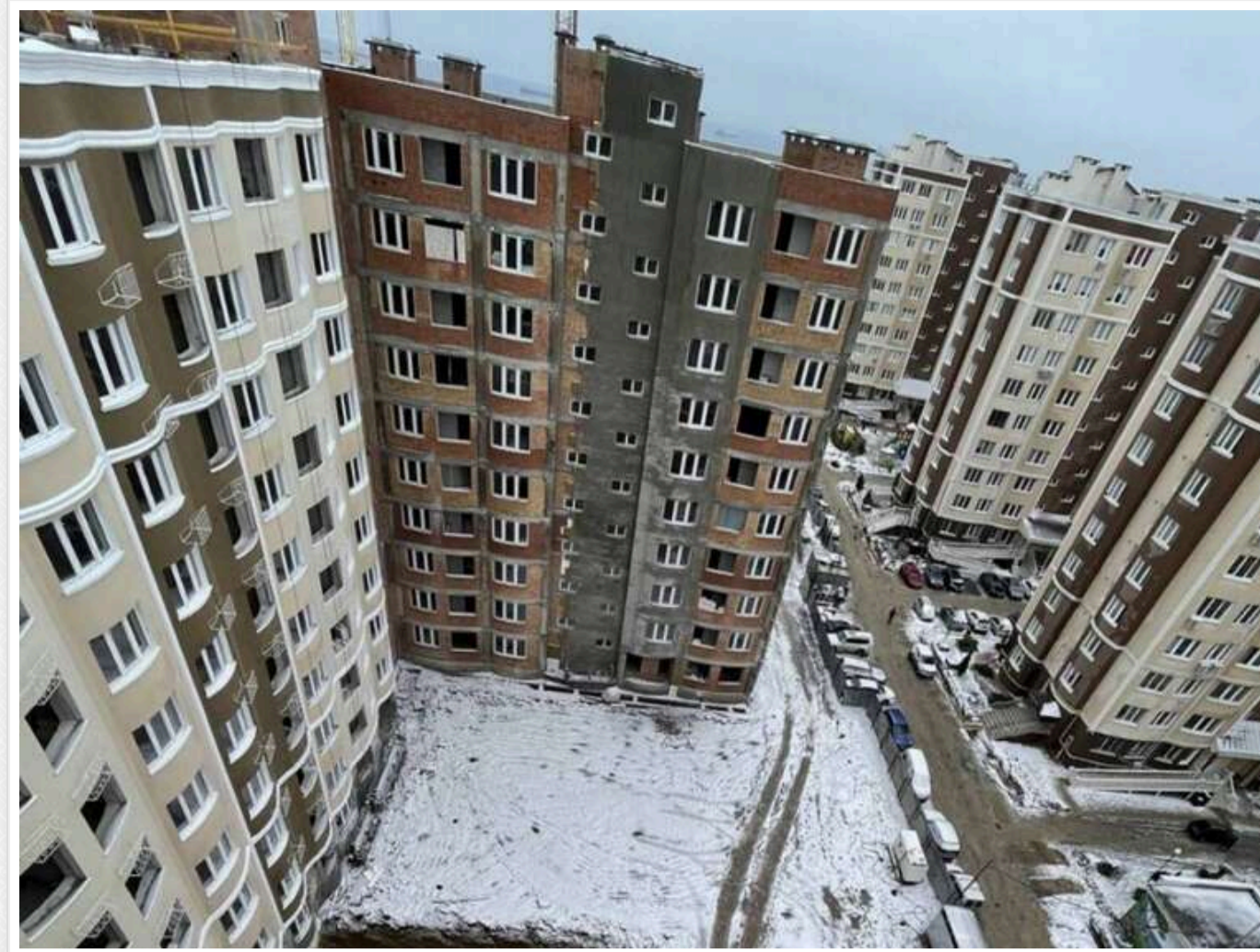
Забудовників у Південному підозрюють в ухиленні від сплати 43 мільйони гривень податків

Забудовників з Південного (Южне) на Одещині підозрюють в ухиленні від сплати податків на 43 млн гривень під час будівництва житлових комплексів.