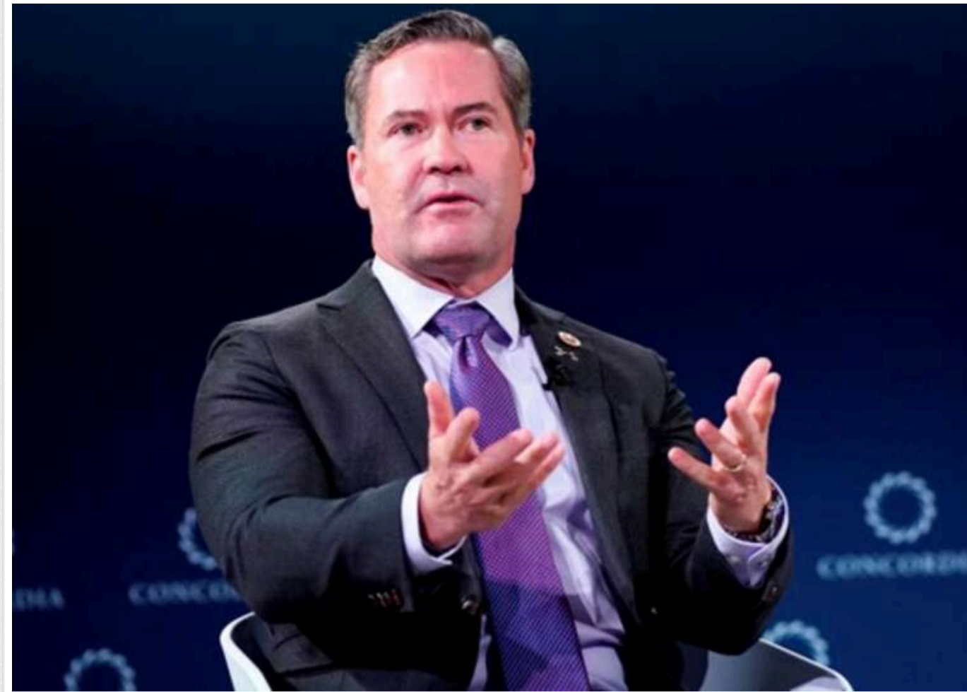
Радник Трампа розкритикував Україну за "спротив" угоді щодо корисних копалин і заговорив про "ескалацію риторики"

Радник президента США з національної безпеки Майк Волтц, коментуючи останні різкі заяви Дональда Трампа щодо України, згадав про "ескалацію риторики" та "спротив" укладанню угоди про розробку українських корисних копалин.