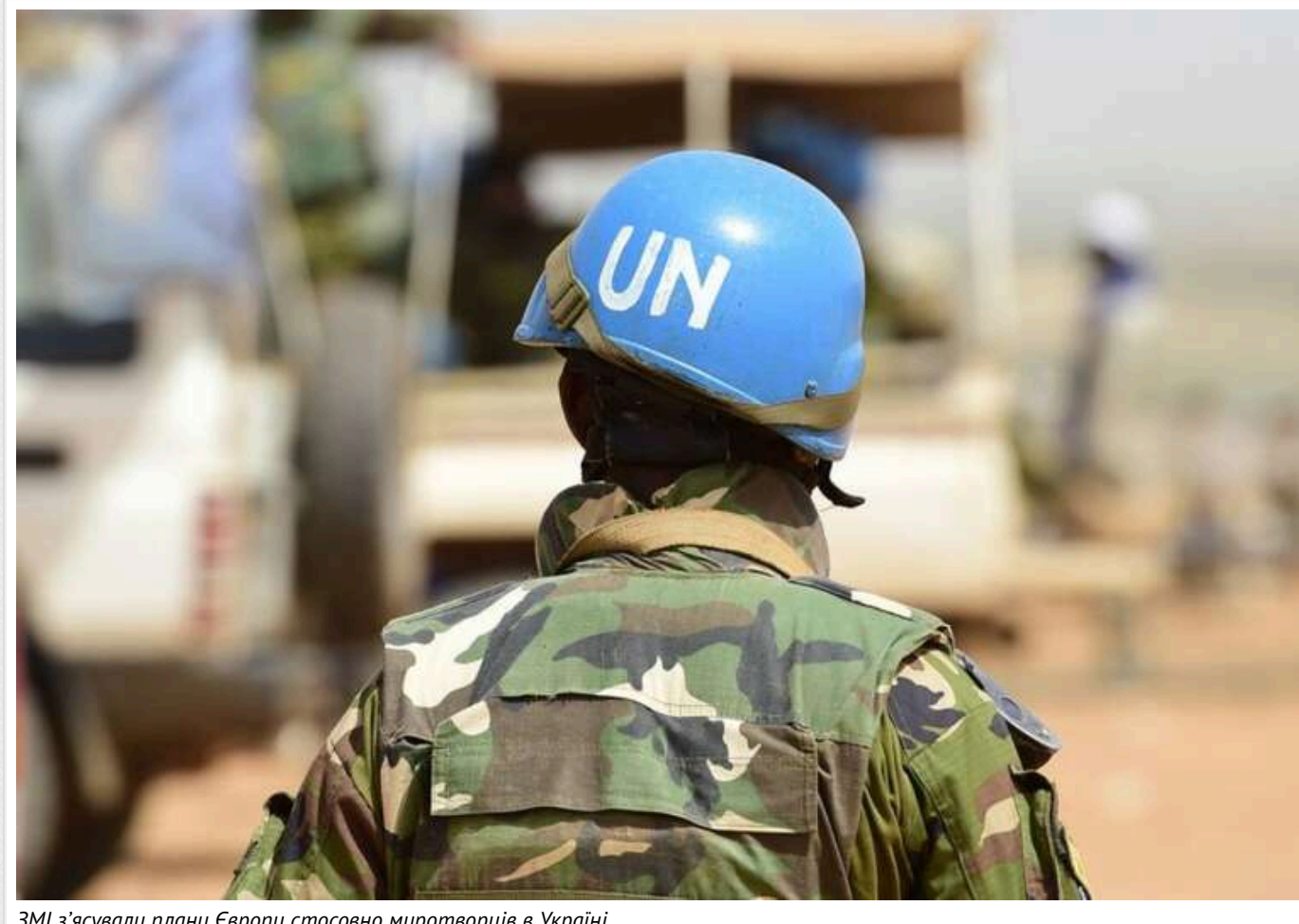
ЗМІ з'ясували плани Європи стосовно миротворців в Україні

Європейські країни можуть надіслати миротворців до України для нагляду за дотриманням режиму припинення вогню. Очікується, що контингент складатиметься з до 30 тисяч військовослужбовців.