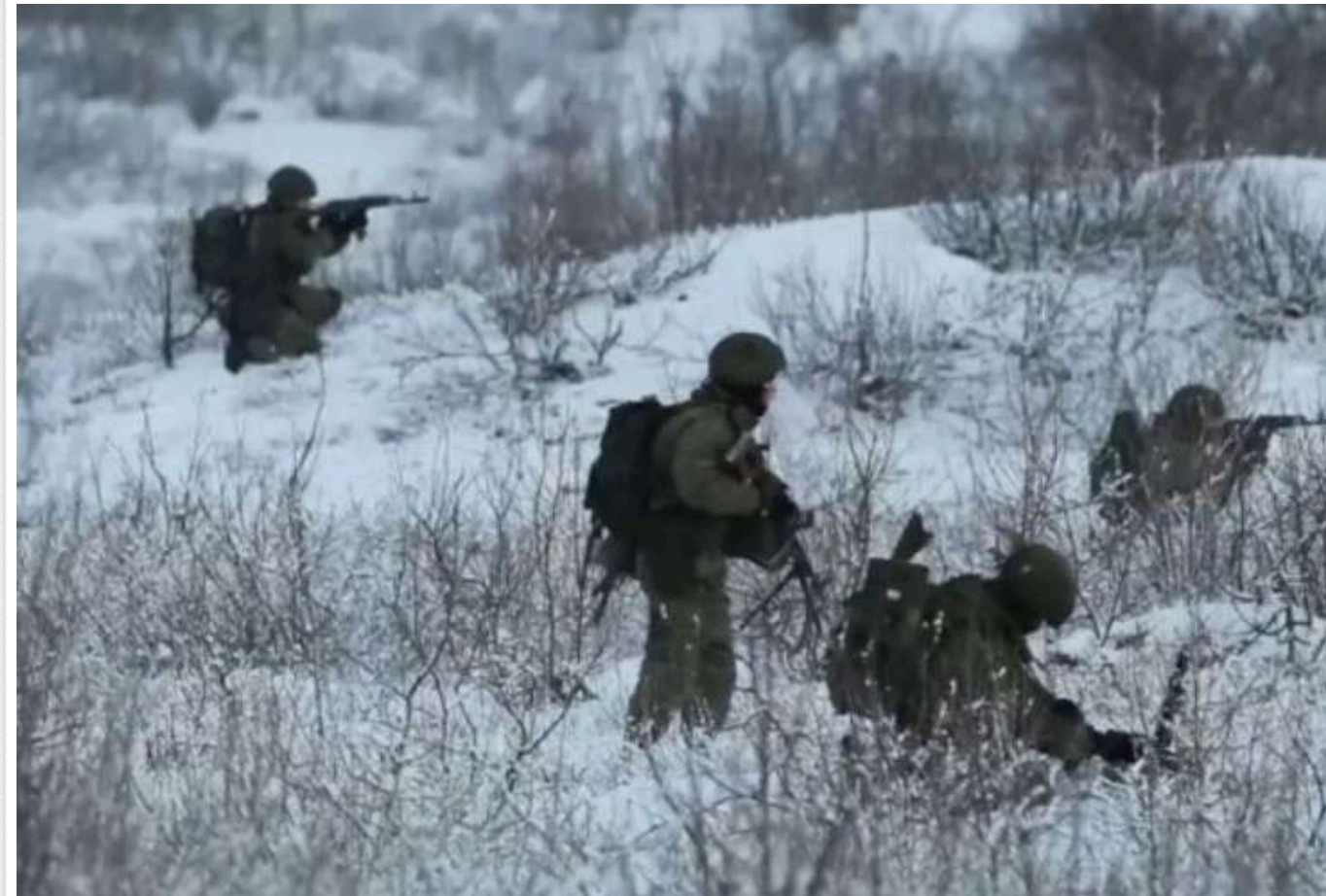
На передовій ЗСУ помітили російських штурмовиків у кайданах

Окупанти діють комбіновано, застосовують малі штурмові групи, які намагаються наблизитись до лінії бойового зіткнення і зав'язати бої. Зазвичай це групи до 5 осіб на мотоциклах, квадроциклах, багі та легковиках.