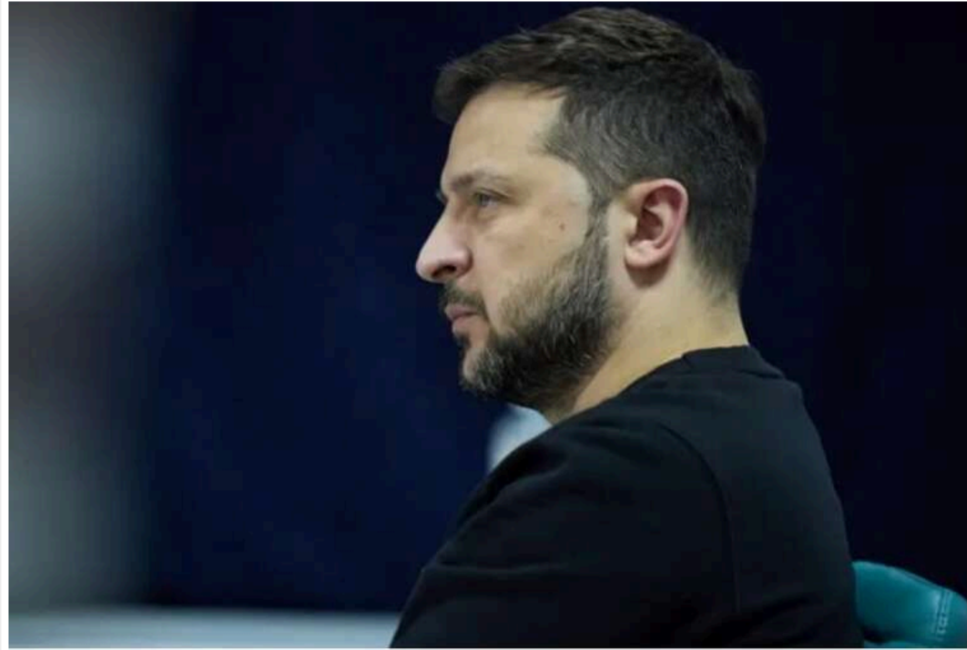
Зеленський розповів, яка кількість українців підтримує поступки росіянам

Українці не довіряють кремльському диктатору Володимирі Путіну та не готові йти на всі поступки, яких вимагає від нас Росія. Спецпредставнику президента США з питань України та РФ Кіту Келлогу (який 19 лютого прибув до Києва) варто було б вийти на вулиці й розпитати про це людей.