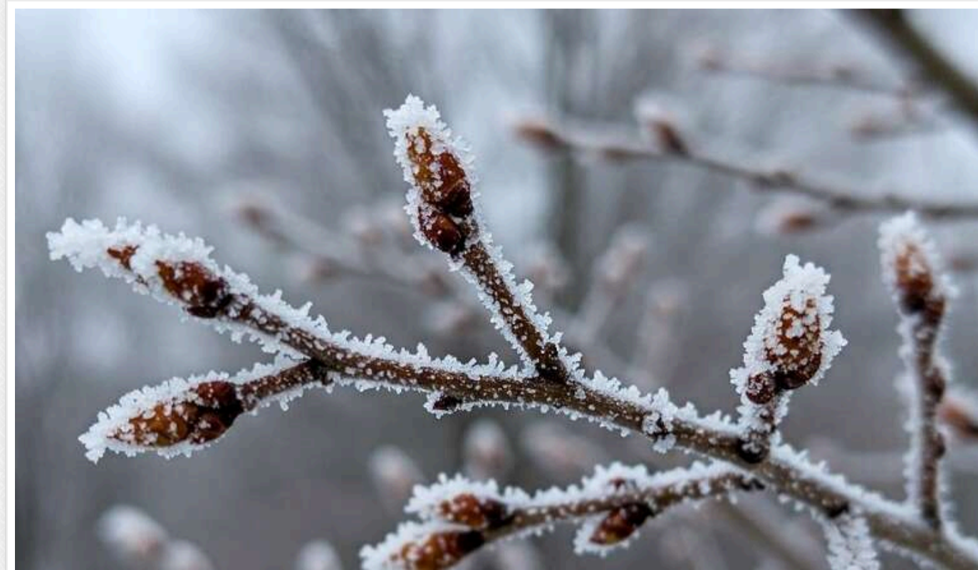
Синоптикня розповіла, де в Україні буде найхолодніше та чи чекати потепління

В Україні погода все ще буде морозною, і холодно буде щонайменше до 25 лютого. У четвер, 19 числа, найнижча температура в нашій країні очікується на сході – до -20 градусів.