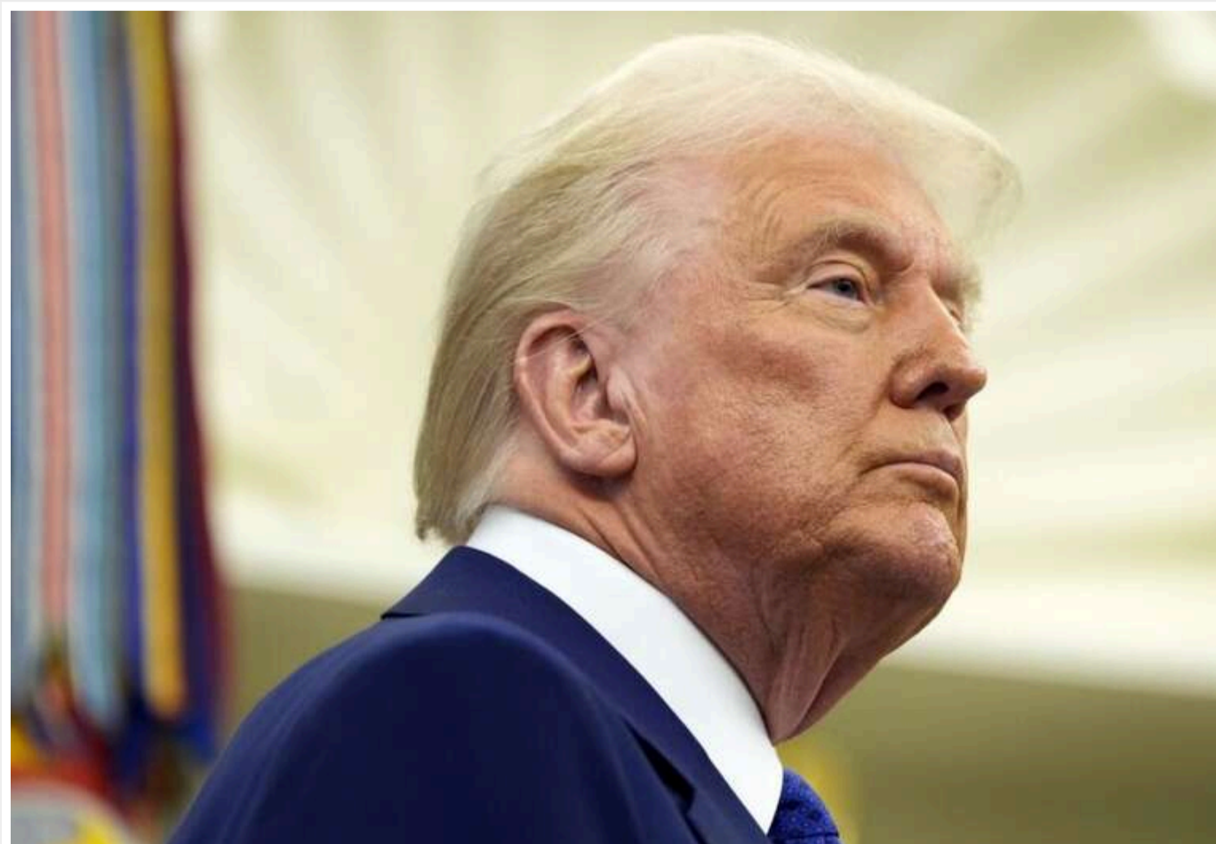
NYP: Трамп вимагає від охопленої війною України неймовірно великої плати

У виданні вважають, що «вичавлювати з країни, ослабленої війною, все, що можна – просто тому, що можна, було б підлістю».