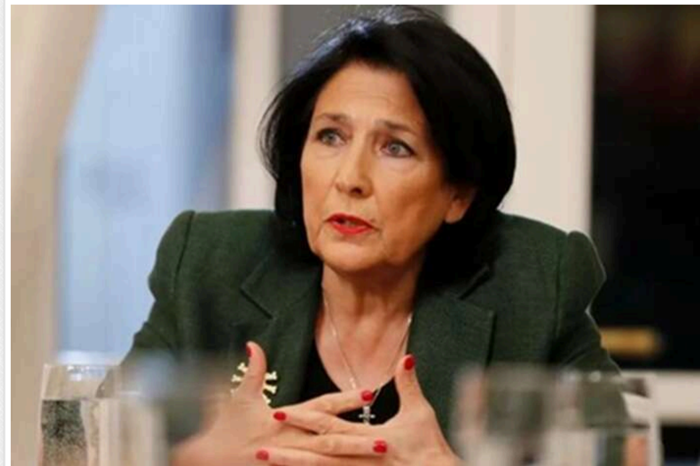
Саломе Зурабішвілі закидали яйцями в аеропорту Грузії: вигукували "зрадниця"

На п'ятого президента Грузії Саломе Зурабішвілі напали в аеропорту. На неї кинули яйця.