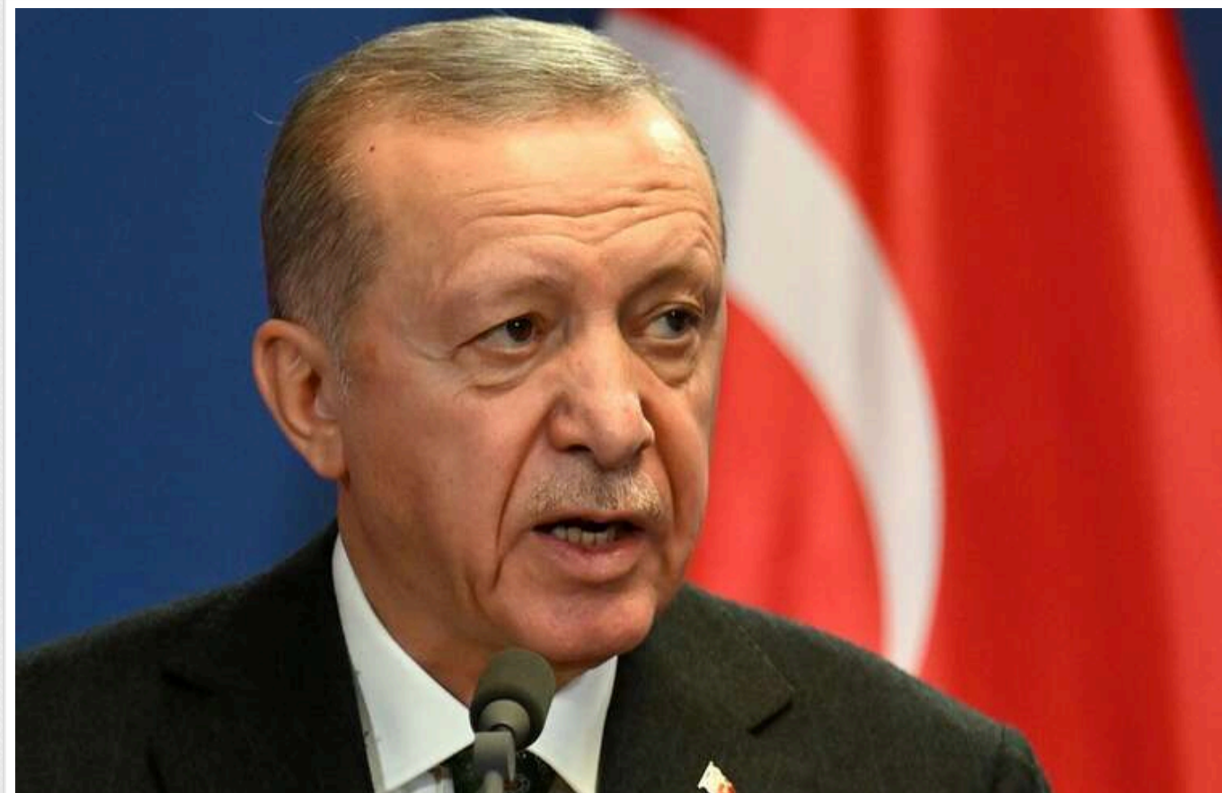
Ердоган заявив, що війна «вже має завершитися»: запропонував Туреччину як переговорний майданчик

На пресконференції із Зеленським Ердоган зазначив, що конфлікт «вже пора закінчити» і запропонував Туреччину як місце для переговорів.