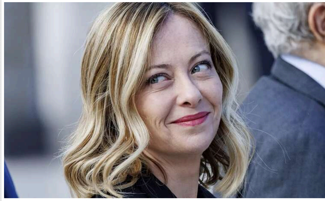
Джорджа Мелоні сумнівається в доцільності відправки миротворців в Україну

Італійська прем'єрка Джорджа Мелоні висловлює сумніви щодо доцільності ідеї відправки європейських військ в Україну для участі в миротворчій місії.