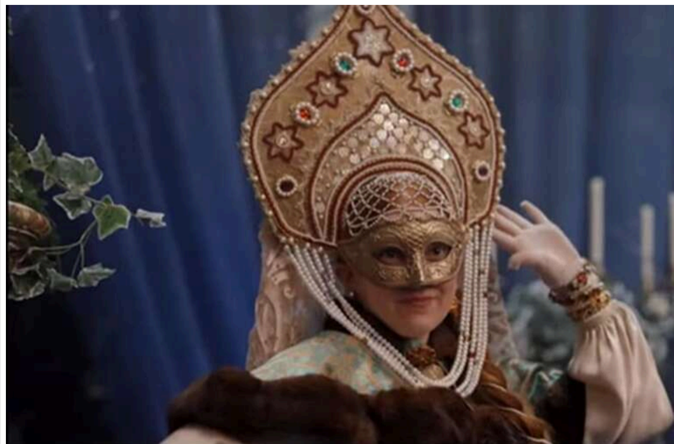
Українців обурив трейлер четвертого сезону "Бриджертонів": на актору надягли російський кокошник

Netflix випустив тизер четвертого сезону популярного серіалу «Бриджертони», в якому показав кадри з майбутнього шоу та закулісну зйомку. Частина українців була обурена тим, що на одну з актрис одягли російський кокошник.