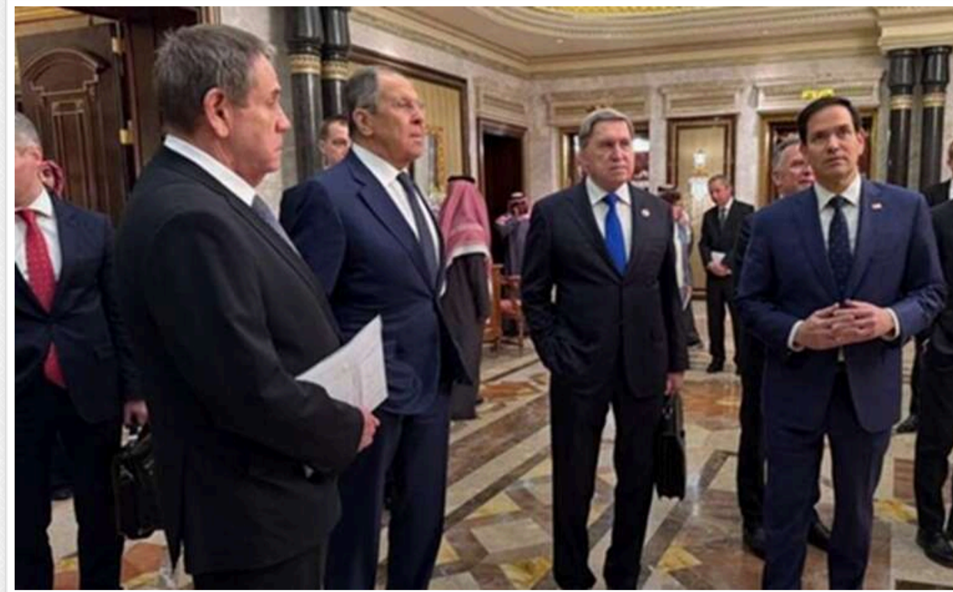
Переговори США і РФ в Саудівській Аравії завершилися: у Держдепі заявили про "важливий крок вперед"

У вівторок, 18 лютого, в Ер-Ріяді, столиці Саудівської Аравії, завершилися переговори між представниками США та Росії.