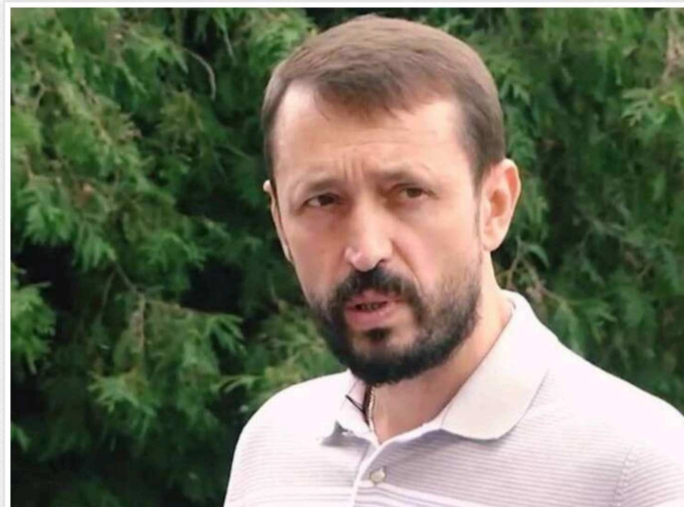
Нардеп від «Батьківщини» Валерій Дубіль може бути причетний до незаконного будівництва на державних землях – розслідування

Народний депутат від «Батьківщини» Валерій Дубіль може бути причетний до незаконного будівництва на державних землях у Чернігівській області.