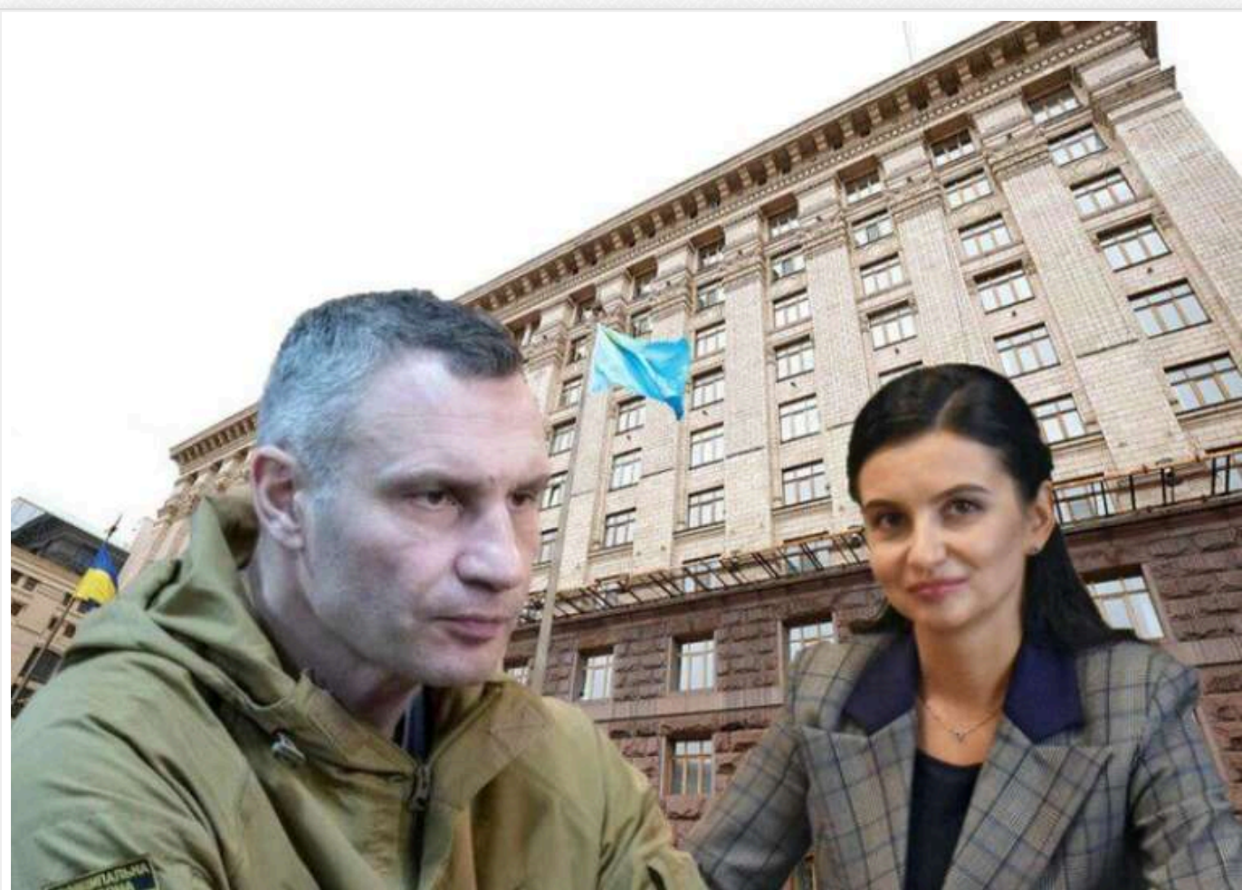
Аудитори КМДА виявили збитки на 348 мільйонів гривень у 2024 році

У 2024 році "муніципальні" аудитори провели 81 перевірку фінансово-господарської діяльності столичних КП, структурних підрозділів КМДА і РДА, зафіксувавши при цьому факти порушень на загальну суму 348 млн гривень, з яких 108,2 млн гривень визнані остаточно втраченими. Це більше, ніж було виявлено "ревізорами" позаминулого року, коли було встановлено факти порушень на суму 241,7 млн.