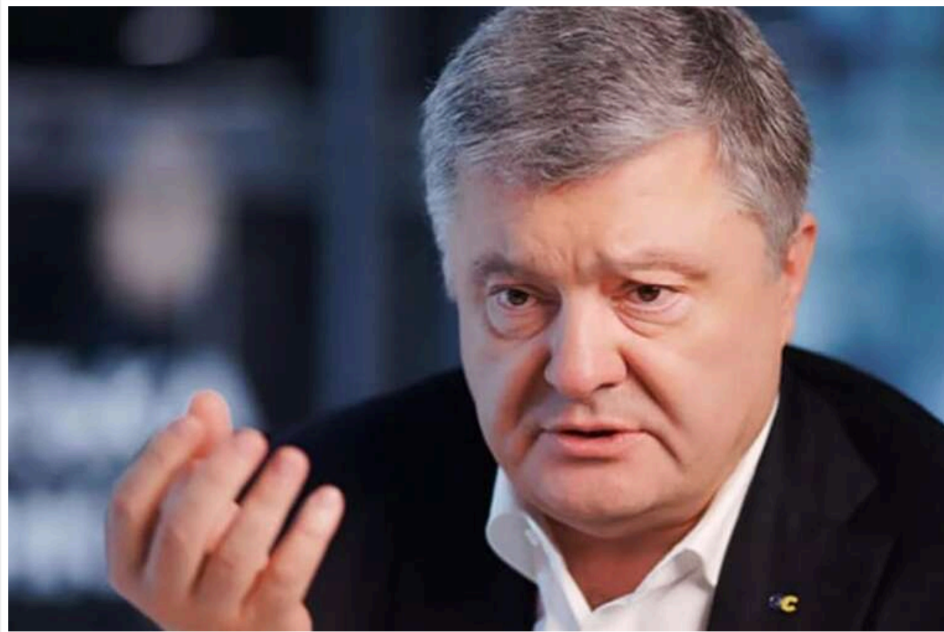
Порошенко планує звернутися до суду через санкції РНБО

Після того, як Рада національної безпеки та оборони ввела санкції проти нього, п'ятий президент України Петро Порошенко звернеться до суду.