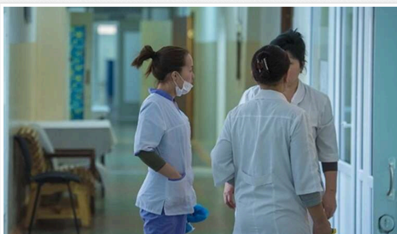
В Україні зростає нестача лікарів та медичного персоналу

В Україні спостерігається не лише нестача медперсоналу, але й небажання випускників шкіль вступати в медичні виші. Про це свідчать кількість заявників 2024 року. Чим це пояснюється і що з зарплатами лікарів та медсестер, які працюють в Україні?