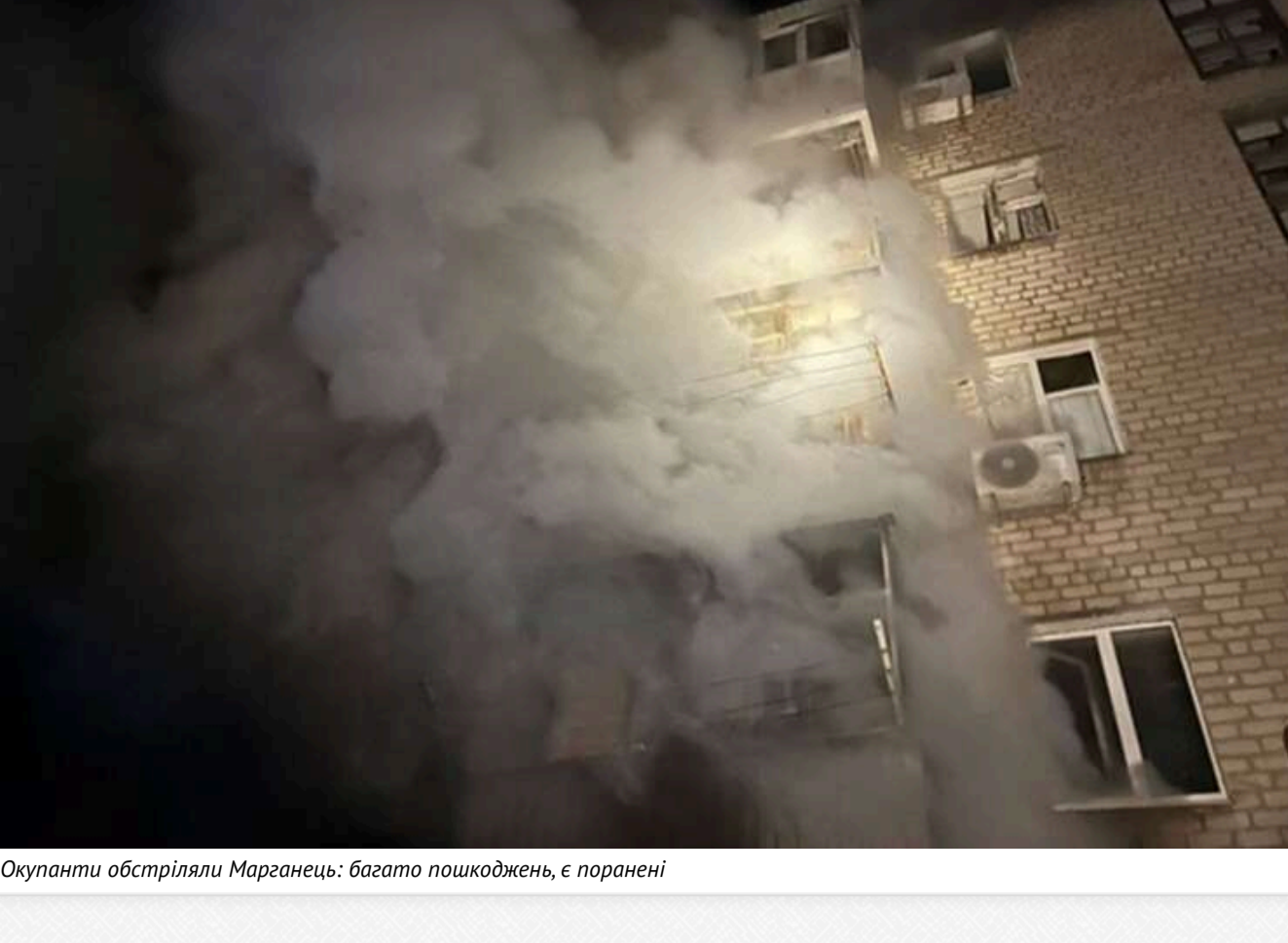
Окупанти обстріляли Марганець: багато пошкоджень, є поранені

Російські окупанти здійснили артилерійський обстріл Марганця на Дніпропетровщині. Внаслідок ворожої атаки в місті виникла пожежа, фіксують пошкодження і руйнування багатьох будівель, також є постраждалі.