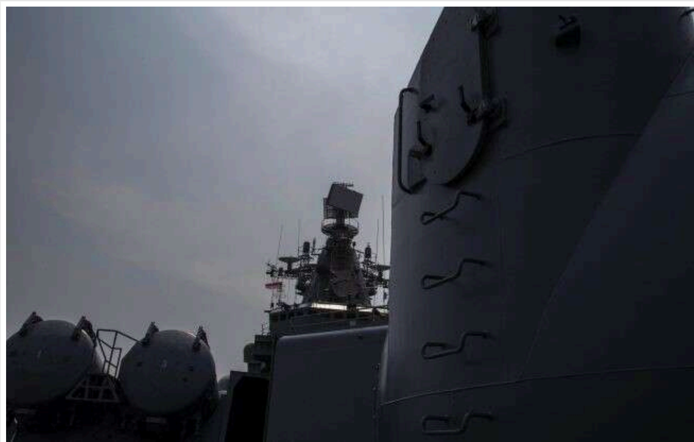
РФ вивела в Чорне море носії "калібрів", - ВМС ЗСУ

Зранку 17 лютого в акваторії Чорного моря зафіксовано один військовий корабель, який Росія вивела на чергування. На борту цього корабля розміщені крилаті ракети "Калібр".