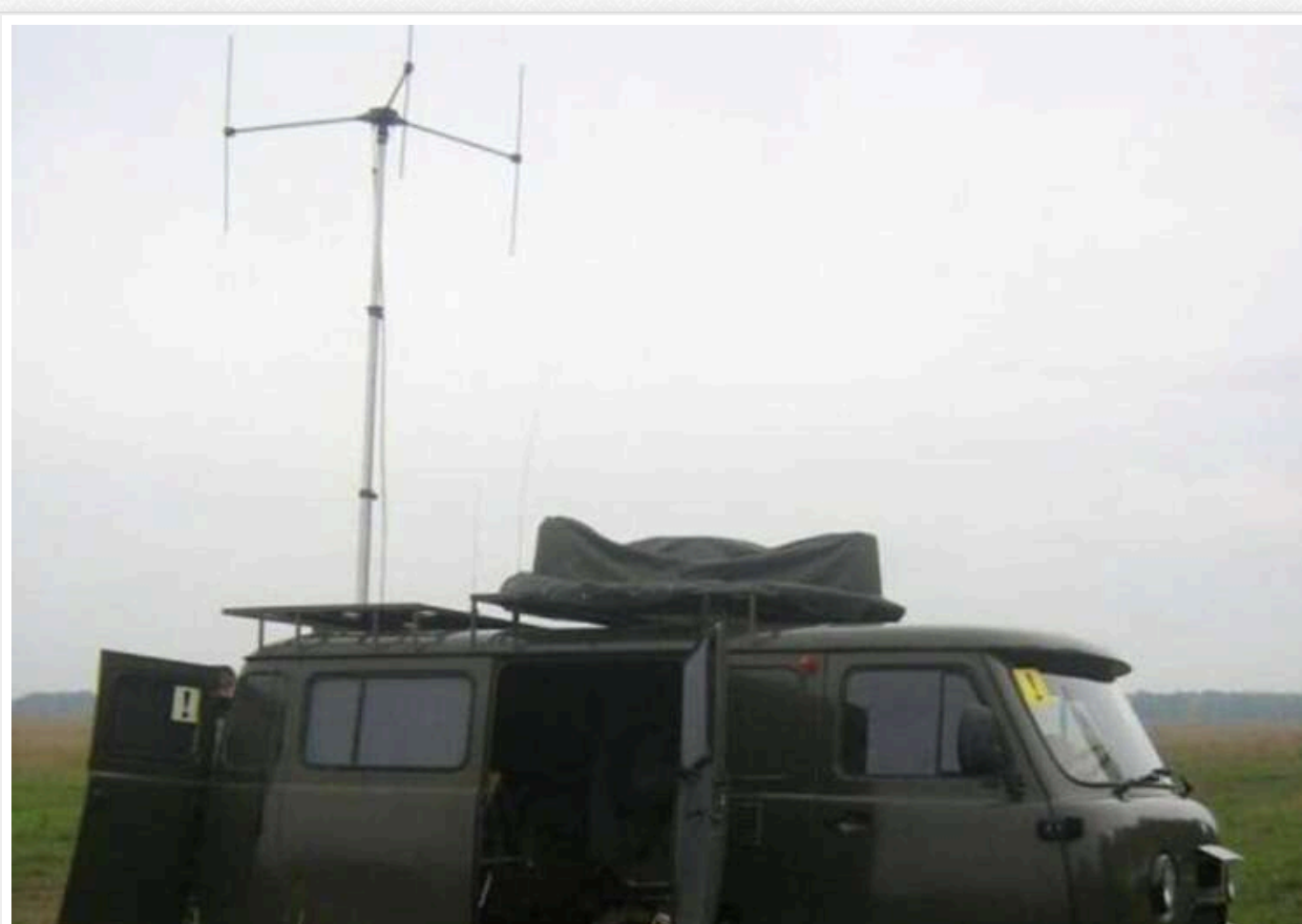
Партизани "АТЕШ" вивели з ладу комплекс радіоелектронної боротьби ворога

Повстанці вивели з експлуатації комплекс радіоелектронної боротьби російської армії, засипавши цукор у паливний бак техніки. Російські військові виявили несправність лише через кілька днів.