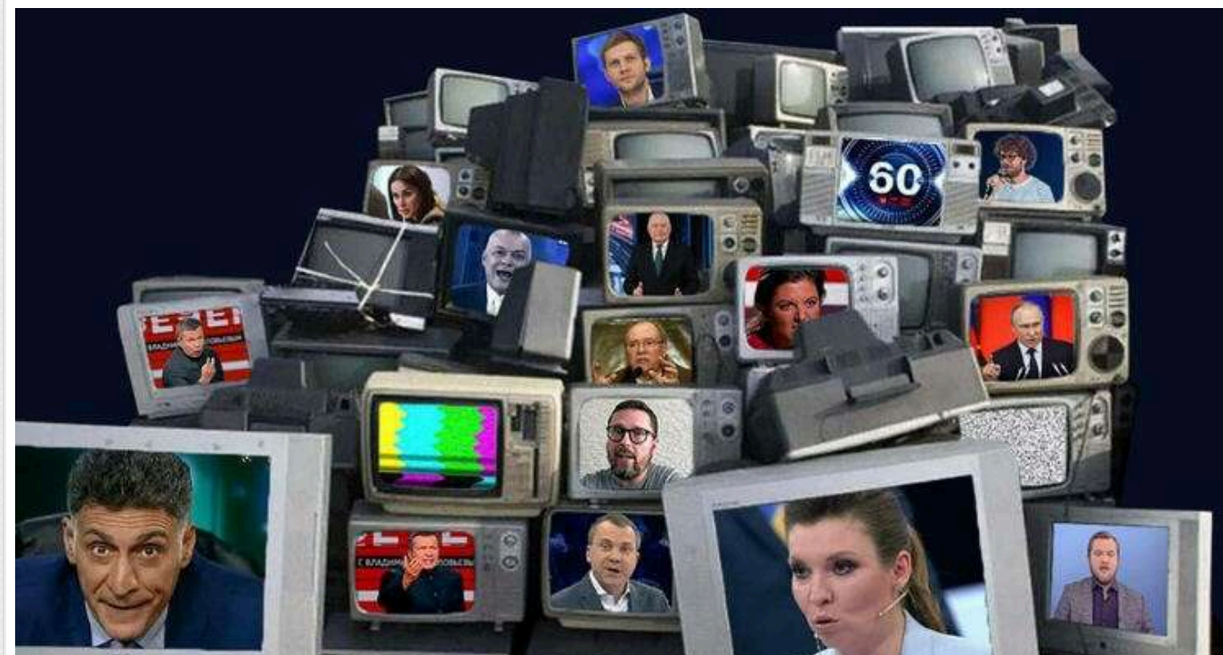
ISW: Росія створює інформумови для порушення потенційної мирної угоди з Україною

Органи влади держави-агресорки Росії офіційно підтвердили свою позицію, що Україна "не має суверенітету". Таким чином, Кремль натякає, ніби Київ не має права вести з ними переговори або що будь-які угоди, досягнуті з українцями в майбутньому, є недійсними.