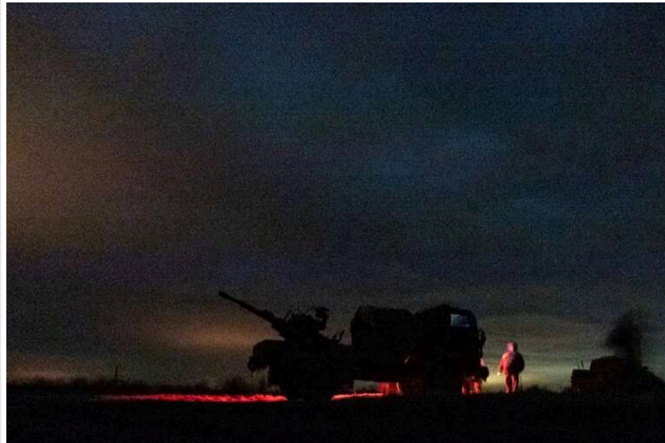
РФ запустила по Україні понад 140 дронів та балістику: збили 95 БпЛА

У ніч на 16 лютого захисники неба знищили над десятками областями України 95 російських дронів різного типу. Ще кілька десятків БпЛА також не досягли своїх цілей завдяки протидії засобами радіоелектронної боротьби.