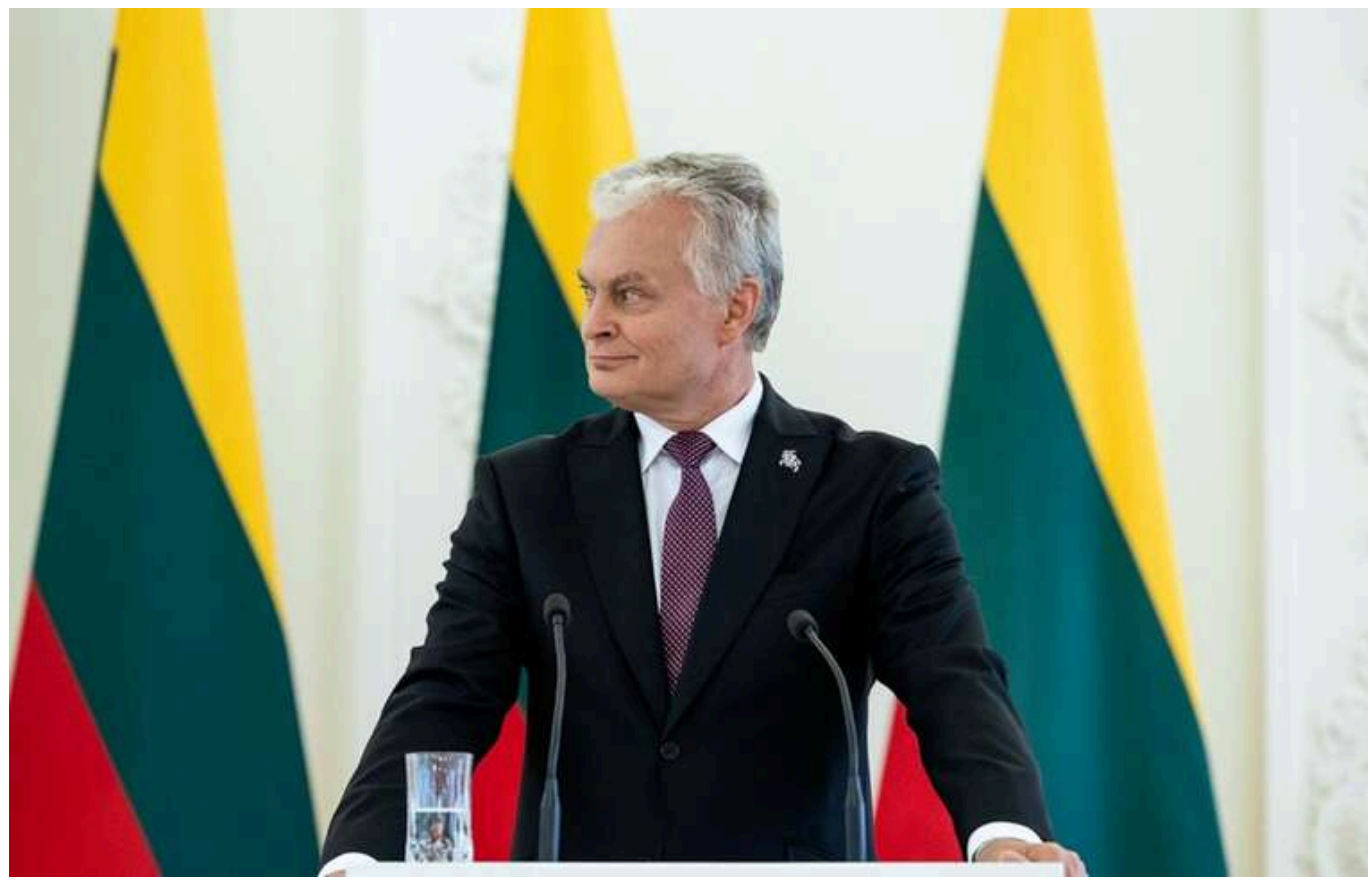
Науседа: РФ буде довгостроковою загрозою для Європи ще 20–30 років

Росія залишатиметься загрозою для Європи щонайменше на найближчі десятиліття. Європейські держави повинні усвідомити цю загрозу та підготуватися до її протидії.