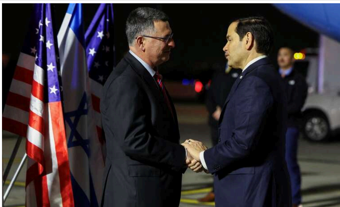
Новий держсекретар США вперше прибув до Ізраїлю

Державний секретар США Марко Рубіо прибув до Ізраїлю. Це його перший візит на Близький Схід на цій посаді. Його зустрів міністр закордонних справ Гідеон Саар.